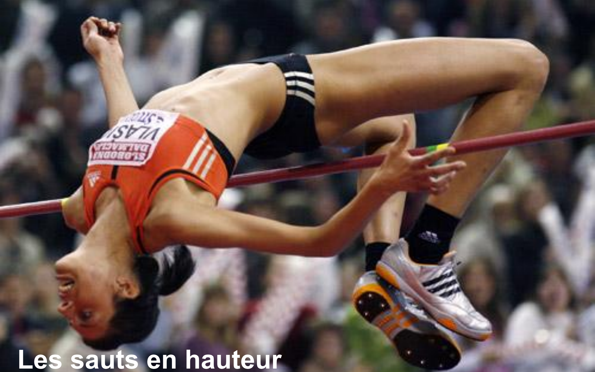
Les sauts en hauteur