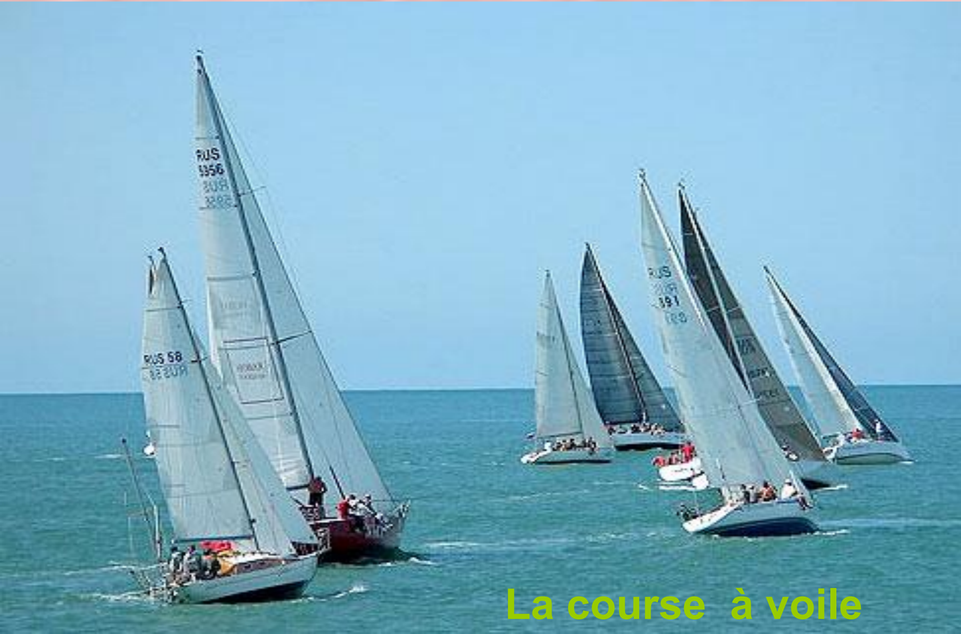
La course à voile