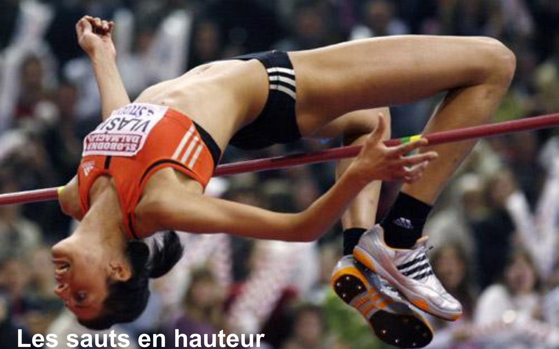
Les sauts en hauteur