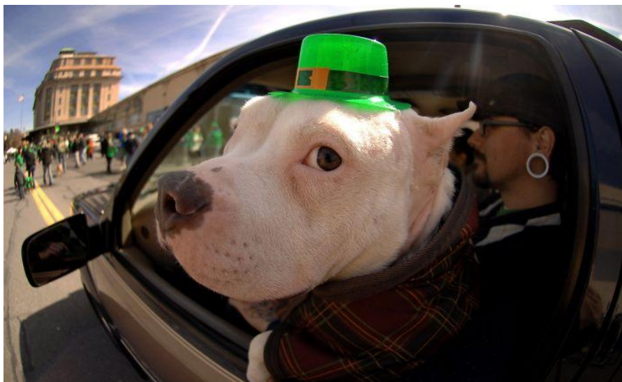
Даже собаки отмечают день святого Патрика