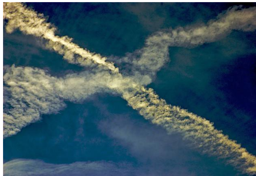
Андреевский флаг в небе