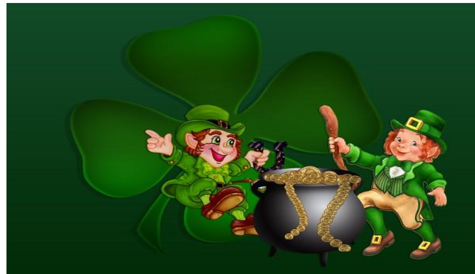
Лепреконы –языческий символ праздника святого Патрика