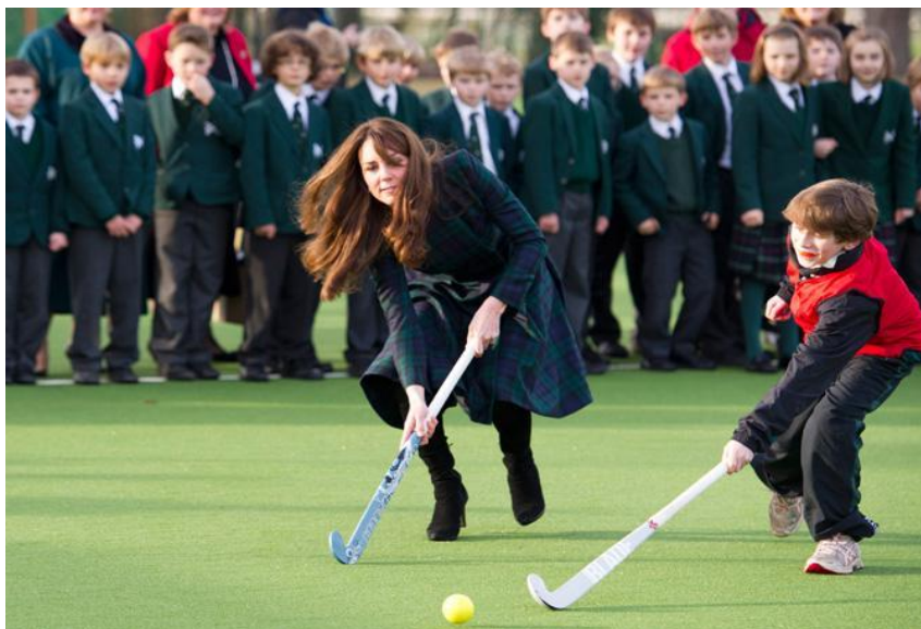
Хоккей на траве в школе святого Эндрю в Беркшире