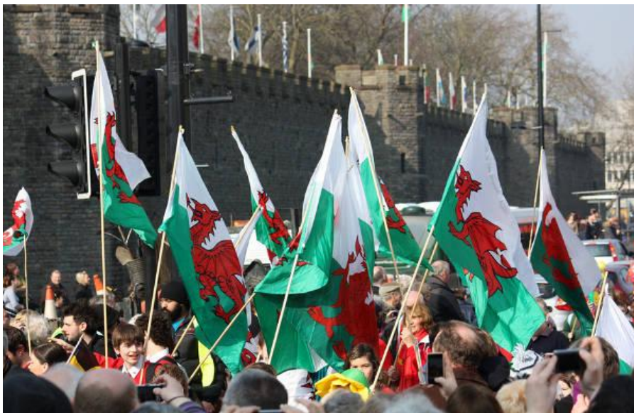
Торжественный парад в день святого Давида