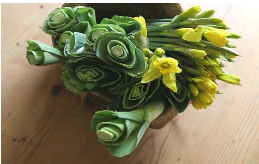
Нарцисс и лук – порей - символы Уэльса