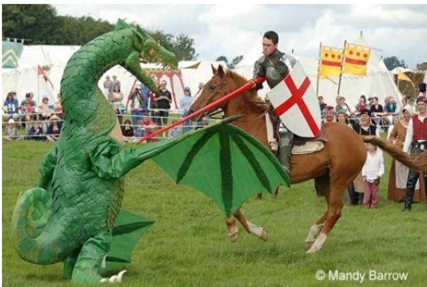
Инсценировка убийства Георгием дракона