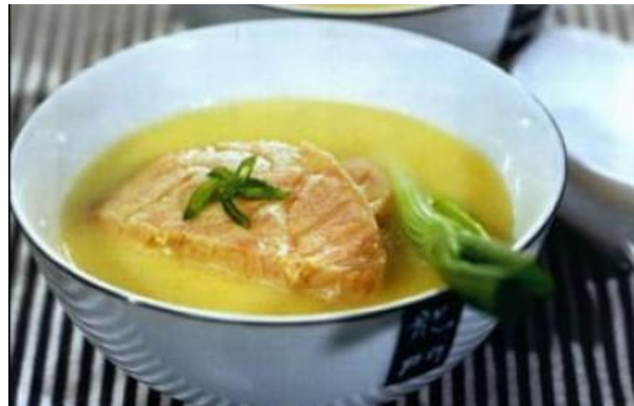
Суп из лосося и лука – порея является традиционным блюдом на день святого Давида