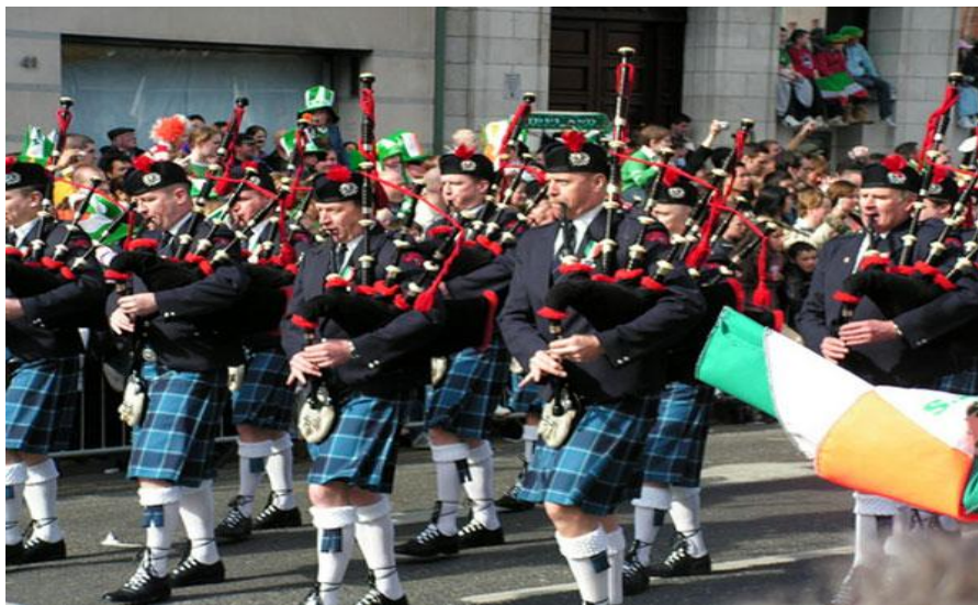
Праздничный парад в Белфасте