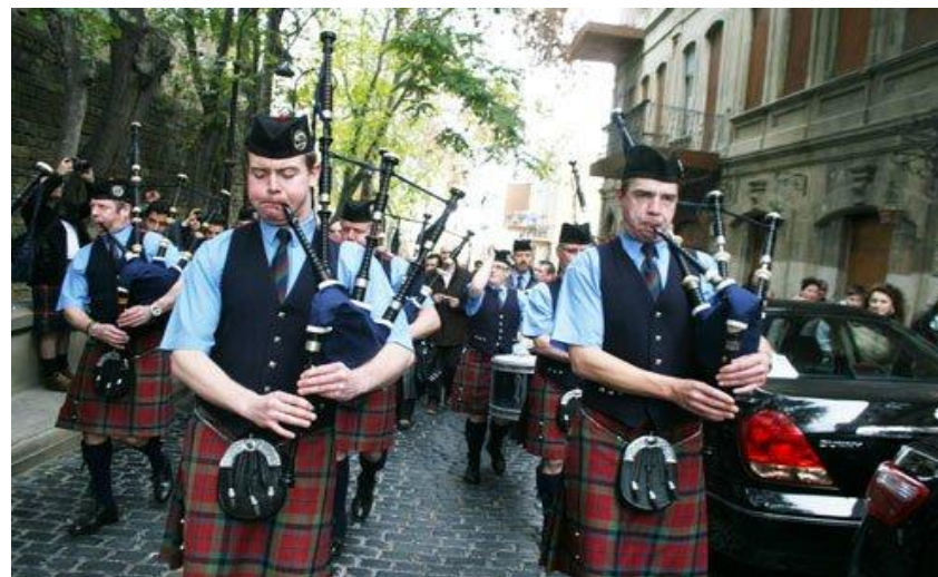
Парад шотландских волынщиков в Ичери Шехер