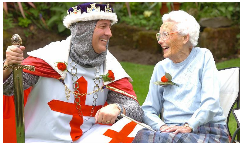
Красные розы – эмблема Англии