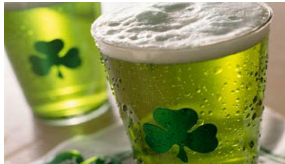
Эль зеленого цвета – традиционный напиток в день святого Патрика