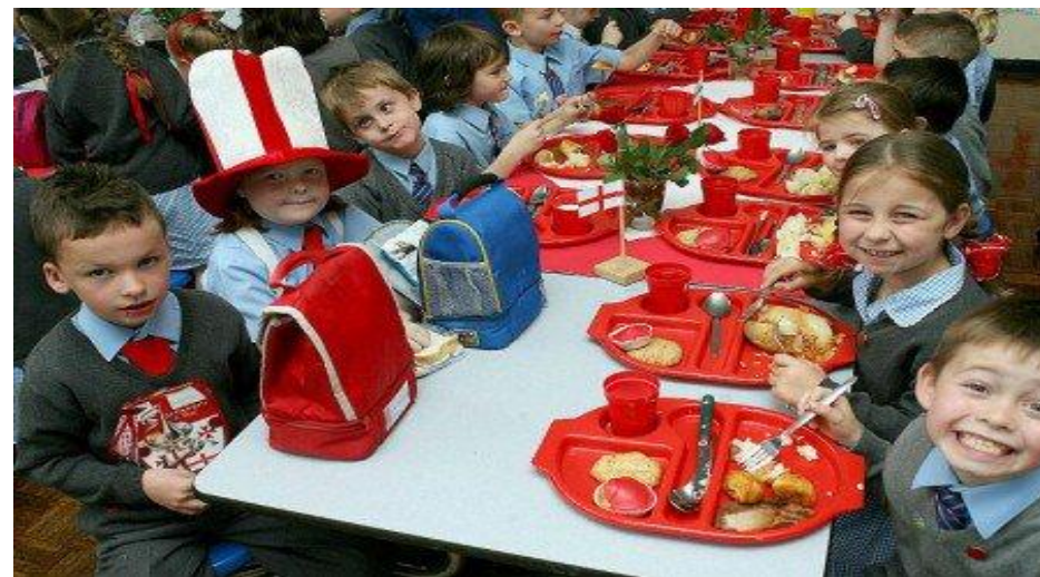
Сосиски в тесте – традиционное праздничное блюдо в школе