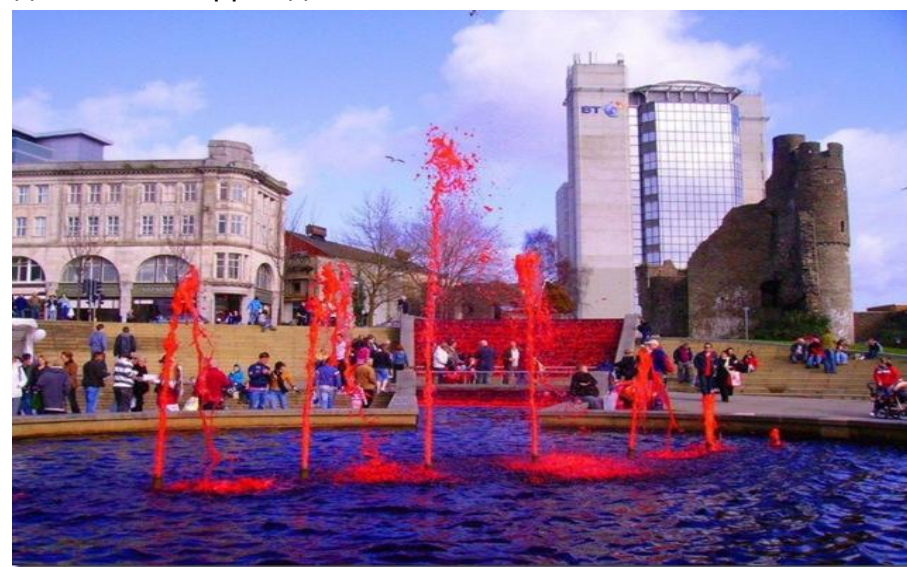
Кровавый фонтан в г. Суонси ( вода в нем с 1 по 9 марта окрашена в кроваво-красный цвет, что символизирует кровь святого Давида)