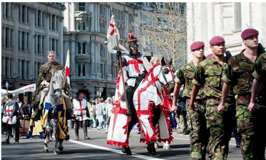
Театрализованное шествие по улицам