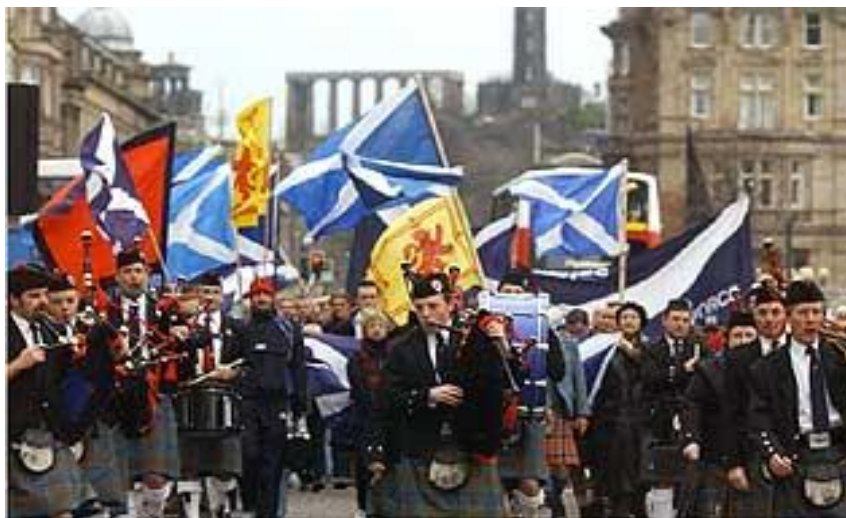
Массовые гуляния с Андреевскими флагами