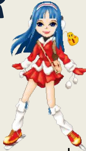
Le patinage artistique