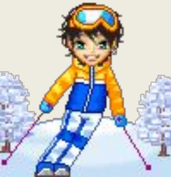
Le ski alpin