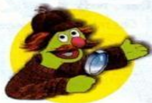
Sherlock Hemlock [ˌʃɜ:lɒk ˈhemlɒk]