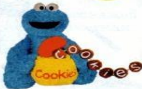
Cookie Monster [ˈkʊki ˌmɒnstə]