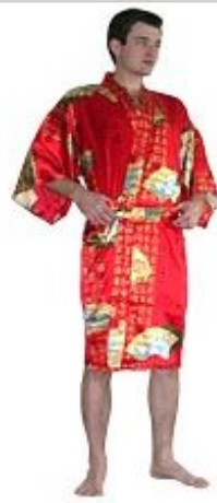
Шелковое Кимоно Никко $ 200