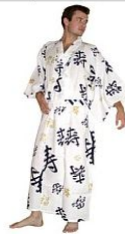
Кимоно Канджи Хлопок $ 129