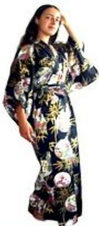
Кимоно Золотой Бамбук Хлопок $135