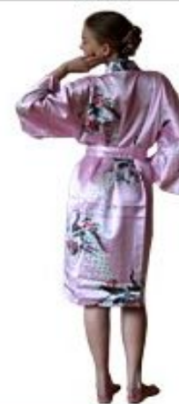
Шелковое Кимоно Асагами $200