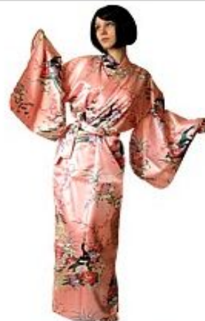
Кимоно Павлин В Саду $139