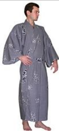
Кимоно Токайдо Хлопок $ 155