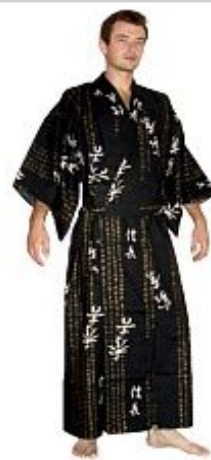
Кимоно Сэнгоку Хлопок $ 145