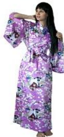
Кимоно Красавицы Эдо $140