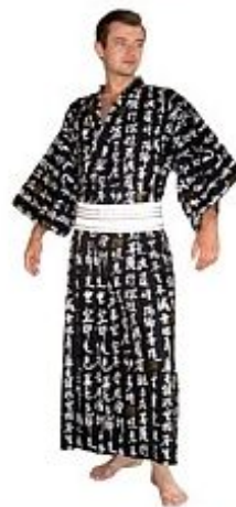
Кимоно-Юката Онсэн Хлопок $ 140