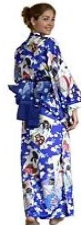
Кимоно Утамаро $138