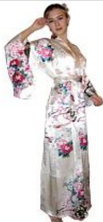
Кимоно Утренний Сад Шелк $265