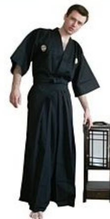
Укороченное Кимоно И Хакاما $ 98 И $ 185