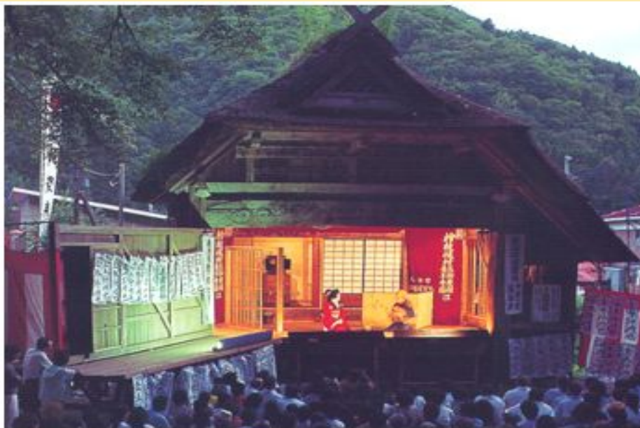
Театр Кабуки дает представление в деревне Хинозмата

Кабуки, самый известный вид классического театрального искусства, насчитывающий примерно 400 - летнюю историю существует и в современной Японии. Он также актуален как и несколько веков назад.