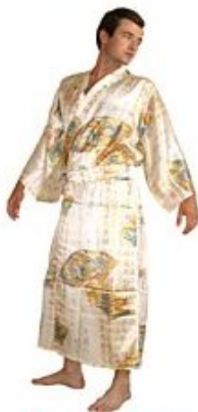
Кимоно Кабуки Шелк $ 265