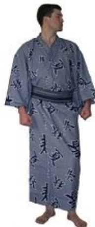
Кимоно Фуджи Хлопок. $ 140