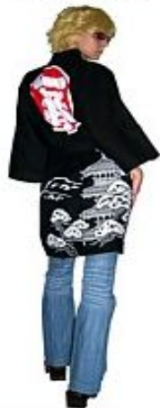
Юката Ичи-Бан Хлопок $80

Существует целая сеть магазинов по продаже кимоно. Например японский Интернет-магазин Interra Japonica ®