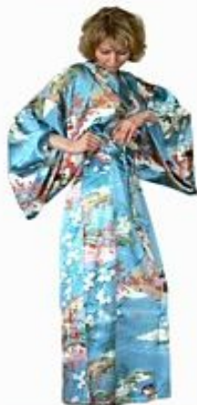
Кимоно Эдогава Шелк $290