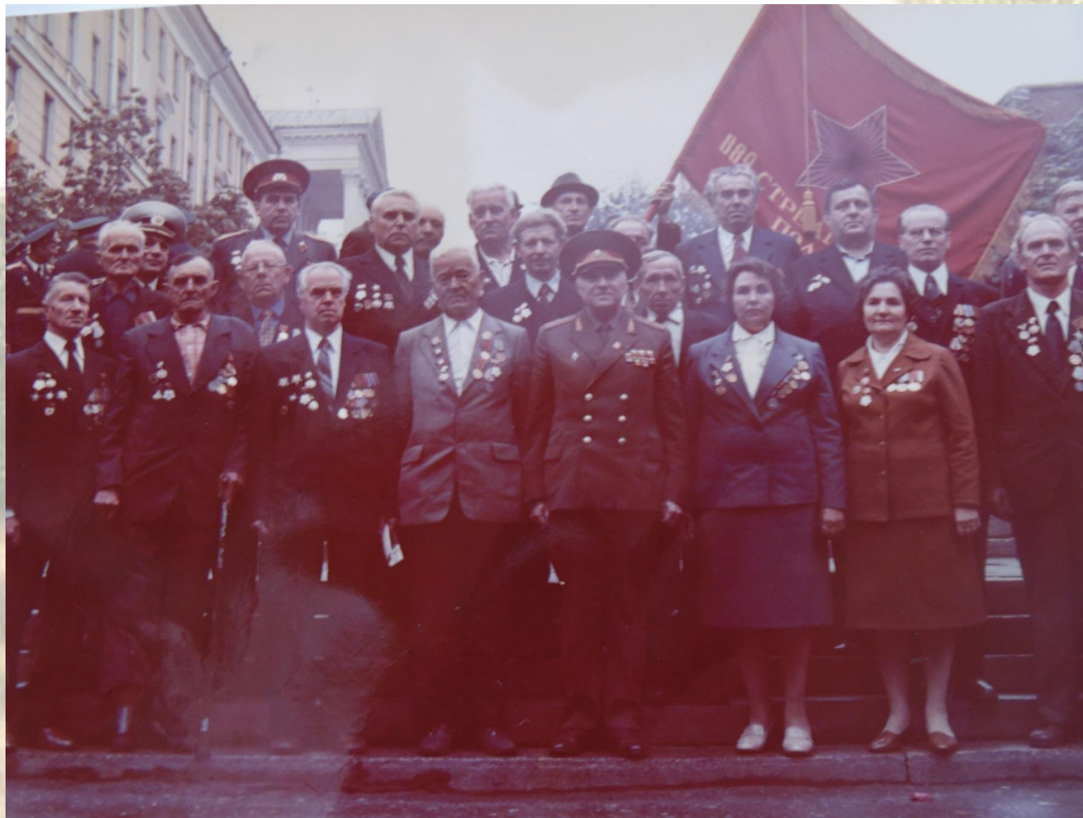
Встреча прадеда с однополчанами