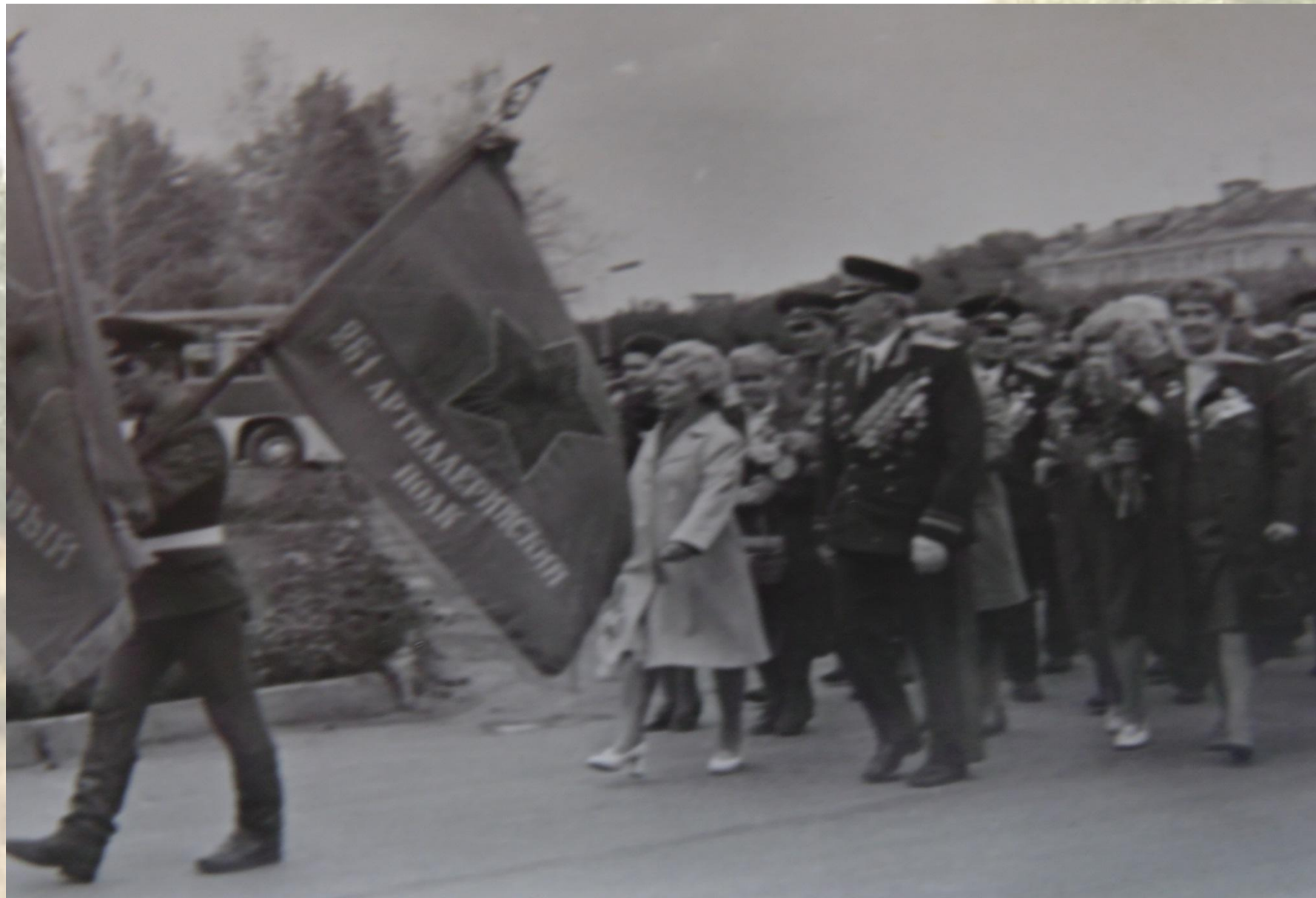
Urgroßvater bei dem Treffen mit Bruder Bryansk 1965