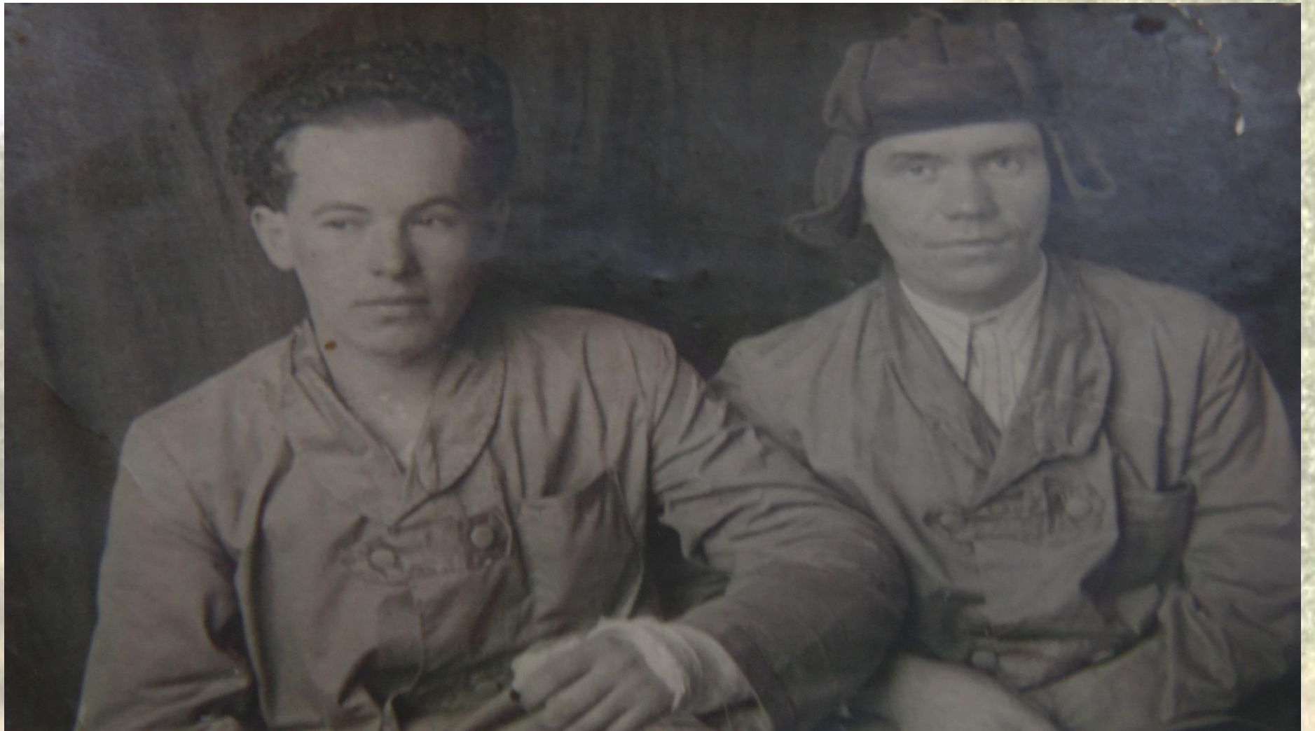
Urgroßvater (links) im Krankenhaus