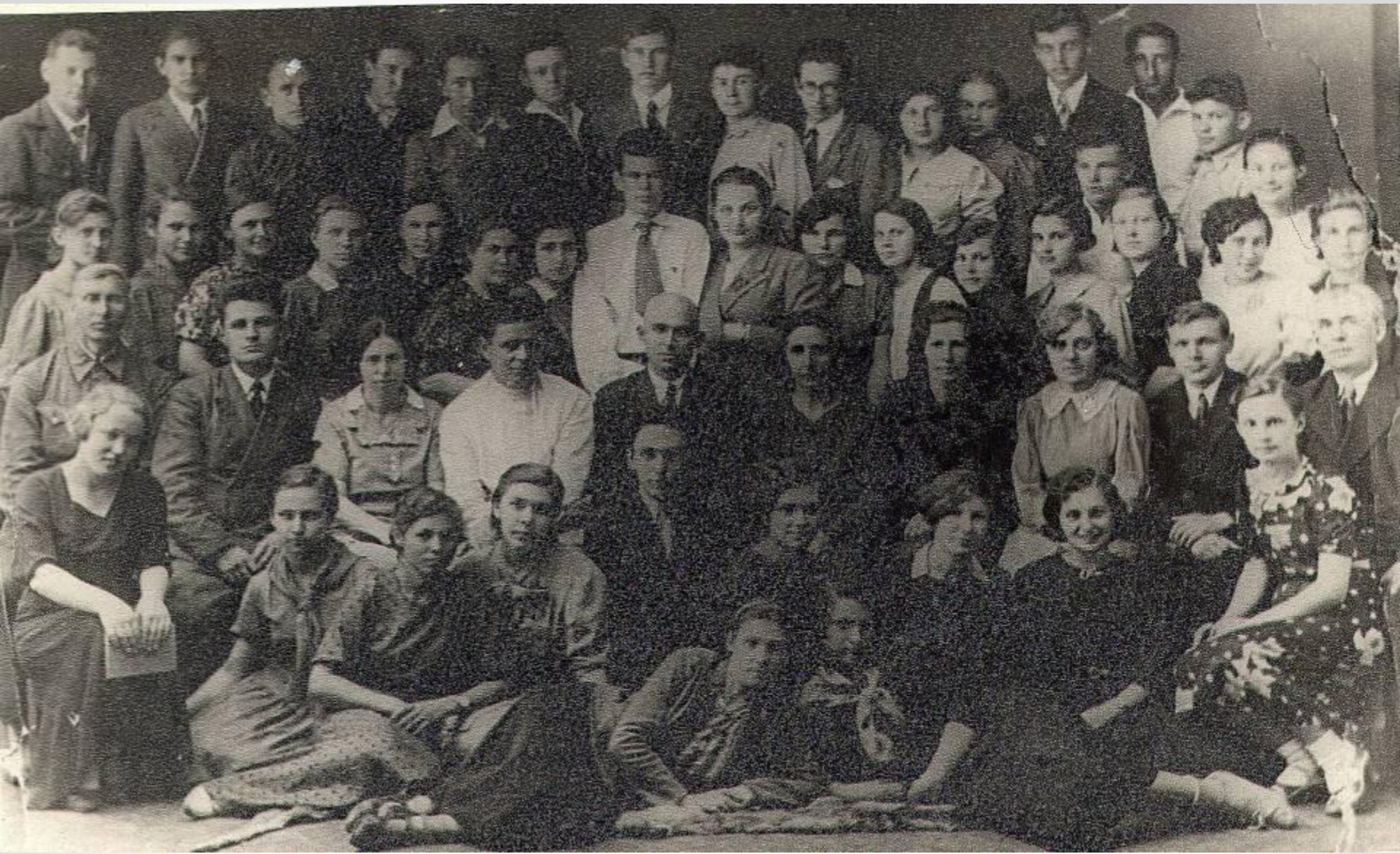
1938. Graduates of model school №9 after Lenin.