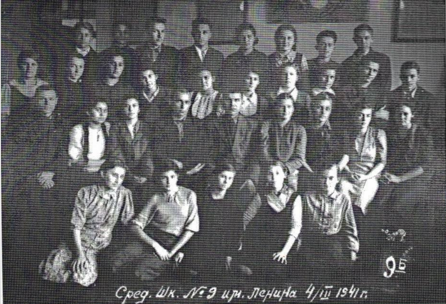
1941. 9b class. Secondary school № 9 after Lenin