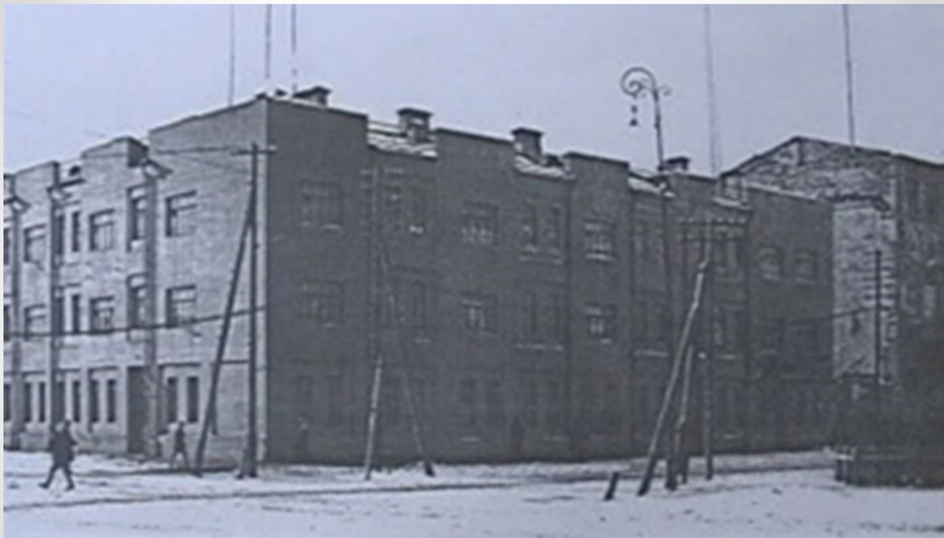
The school building in 1932