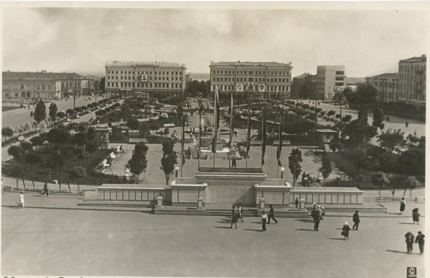
Г. Сталинград. Площадь наших Борцов Революции.