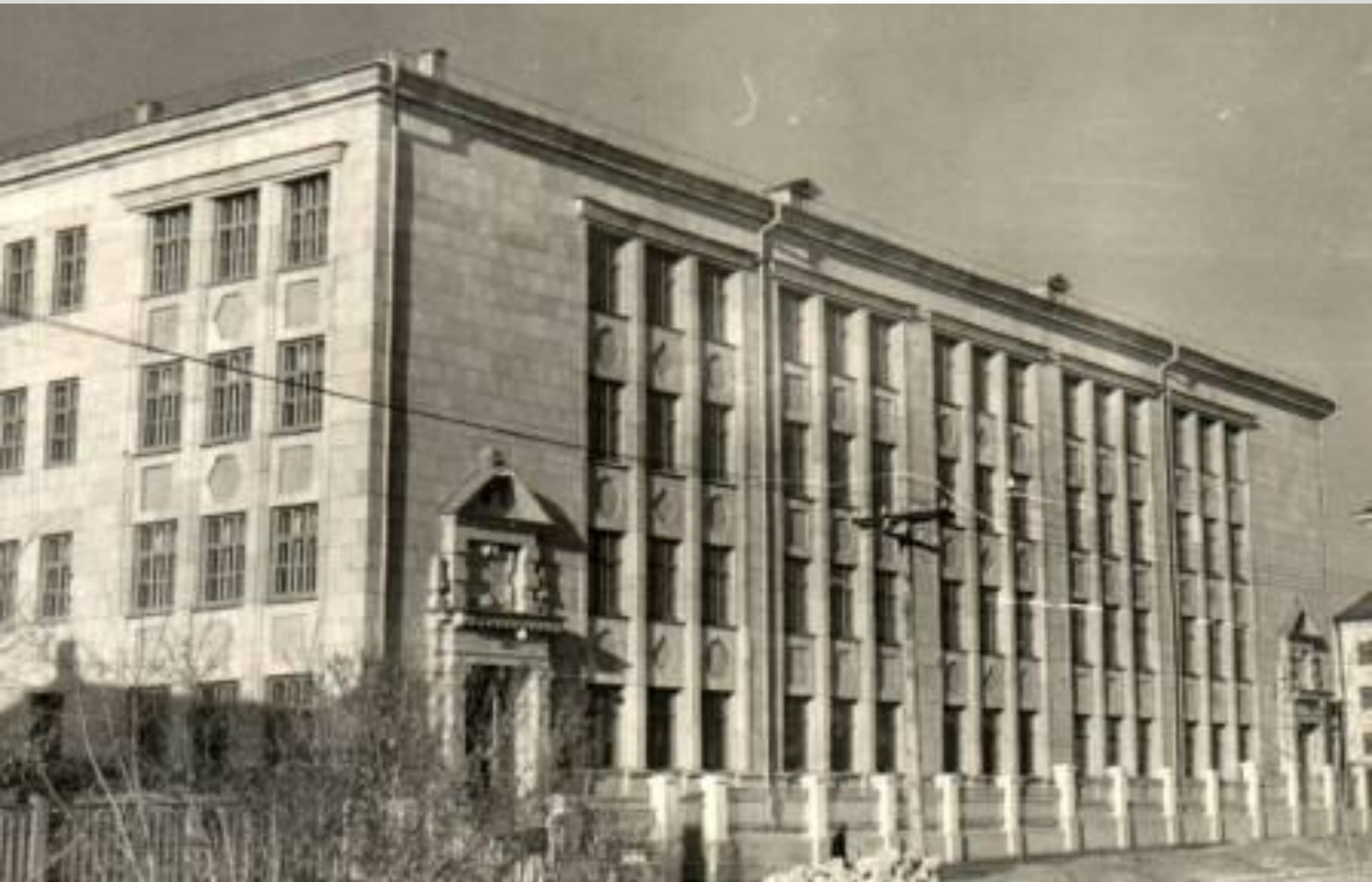
• 1949. The new building of our school •