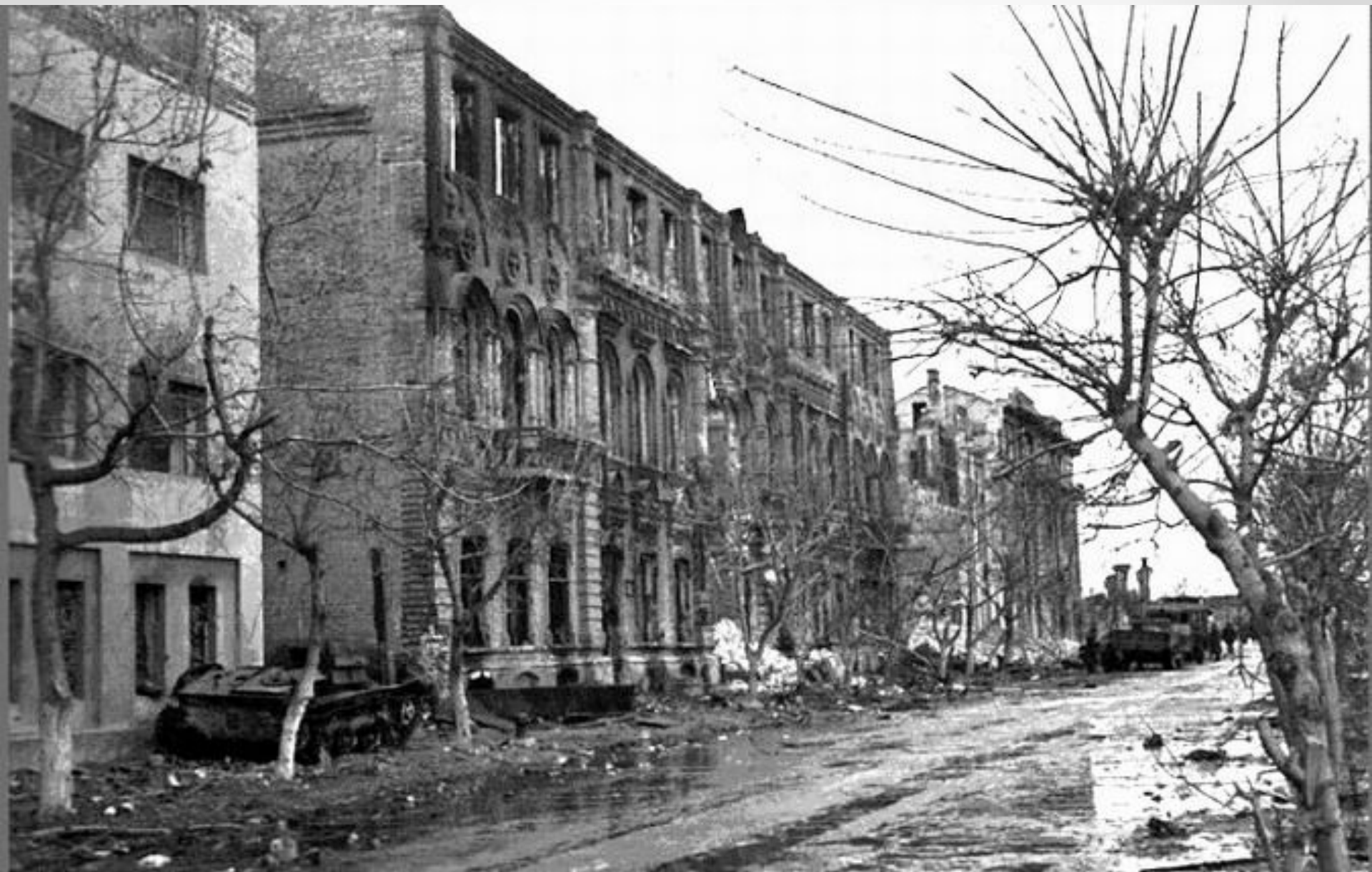
1943. The destroyed building of school № 9 after Lenin.