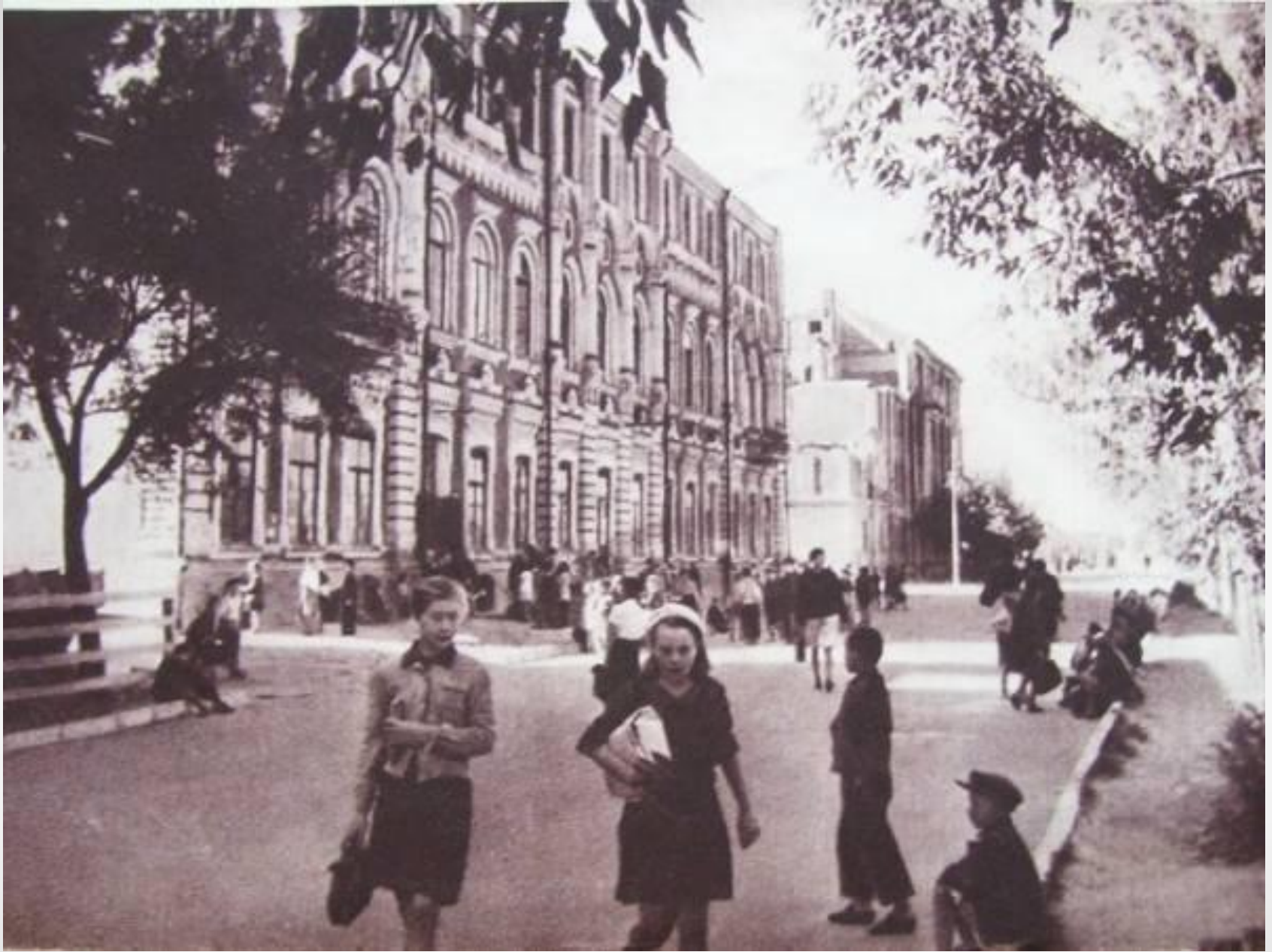
• 1935. The building of school № 9, Lenin street, 21. •