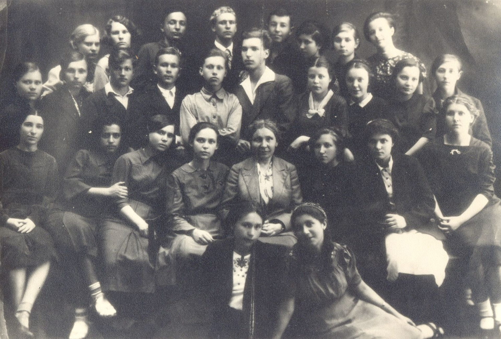
1940. School graduates