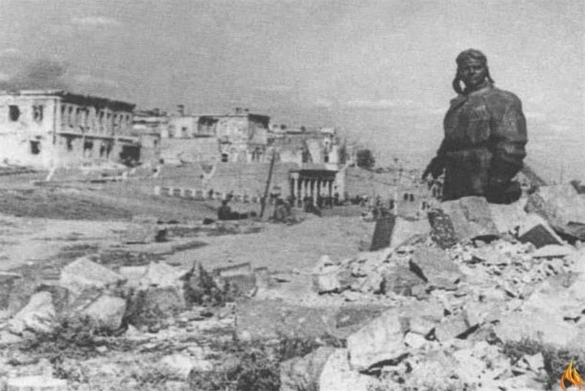
1943. The monument to Kholzunov