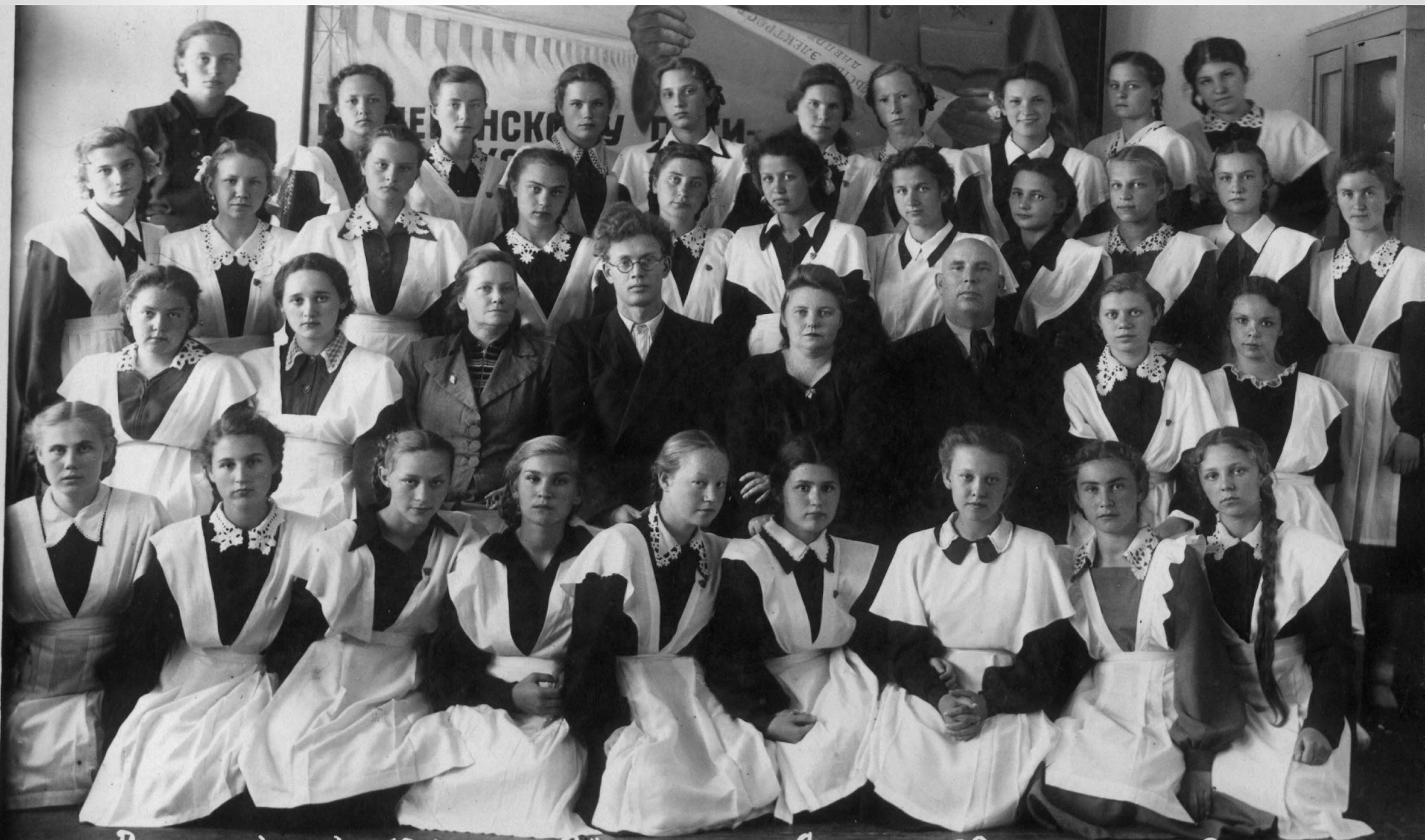
Выпускники 10 класса "Б" школы им. Ленина №9.