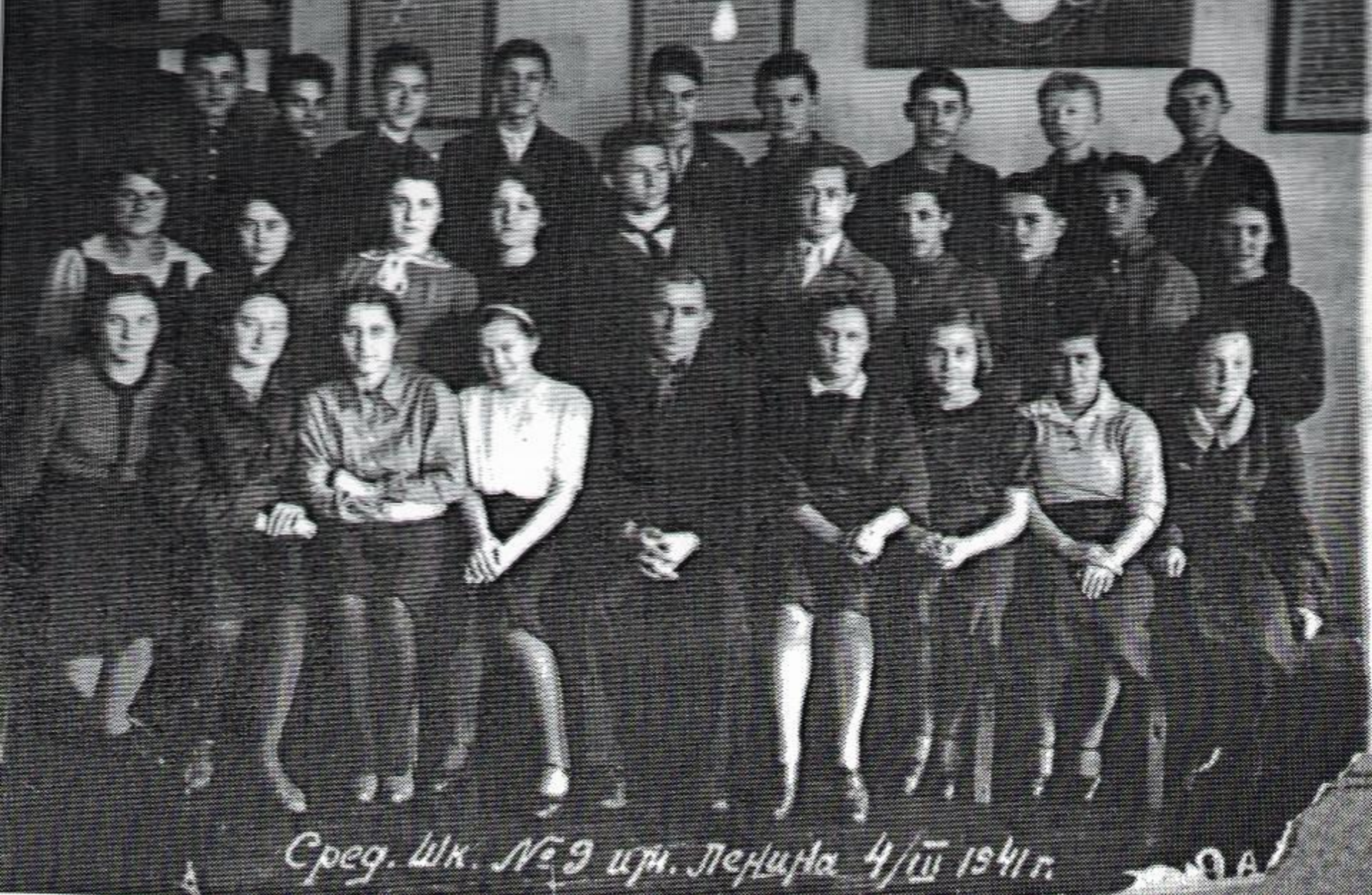
1941. 9a class. Secondary school № 9 after Lenin