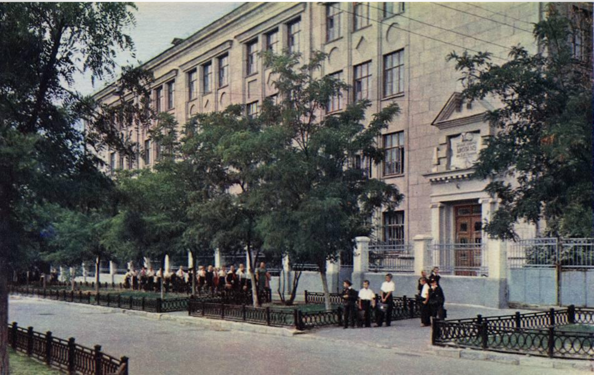
1957 is the secondary school № 9 after Lenin specialized in English