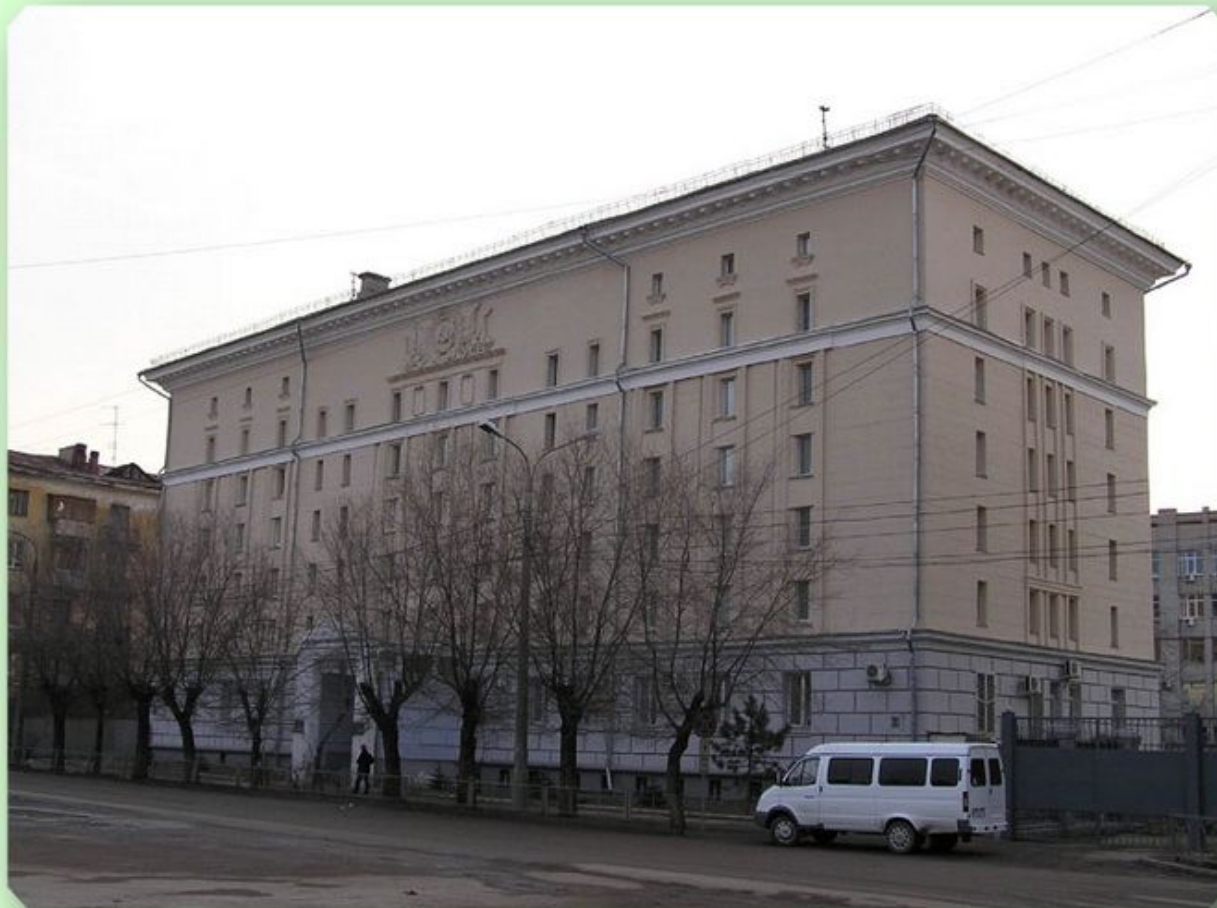
Государственный архив Волгоградской области