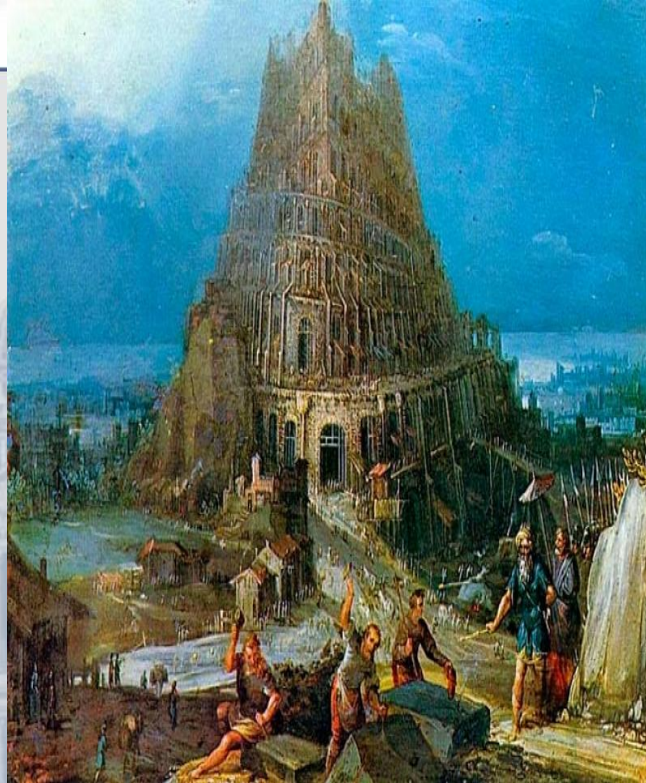
Строительство Вавилонской башни

«На всей земле был один язык и одно наречие. Двинувшись с востока, они нашли в земле Сеннаар равнину и поселились там. И сказали друг другу: наделаем кирпичей и обожжем огнем. И стали у них кирпичи вместо камней, а Земляная смола вместо извести. И сказали они: построим себе город и башню, высотой до небес, и сделаем себе имя, прежде нежели рассеемся по лицу всей земли. И сошел Господь посмотреть город и башню, которые строили сыны человеческие. И сказал Господь вот, один народ, и один у всех язык, и вот что начали они делать, и не отстанут они от того, что задумали делать, сойдем же и смешаем там язык их, так чтобы один не понимал речи другого. И рассеял их Господь оттуда по всей земле: и они перестали строить город. Посему дано ему имя: Вавилон, ибо там смешал Господь язык всей земли, и оттуда рассеял их Господь по всей земле» (Бытие, гл. 11)