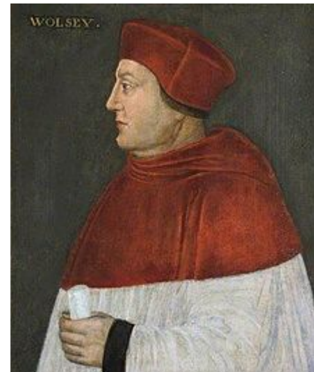
Архиепископ Йоркский и примас Англии Томас Уолси