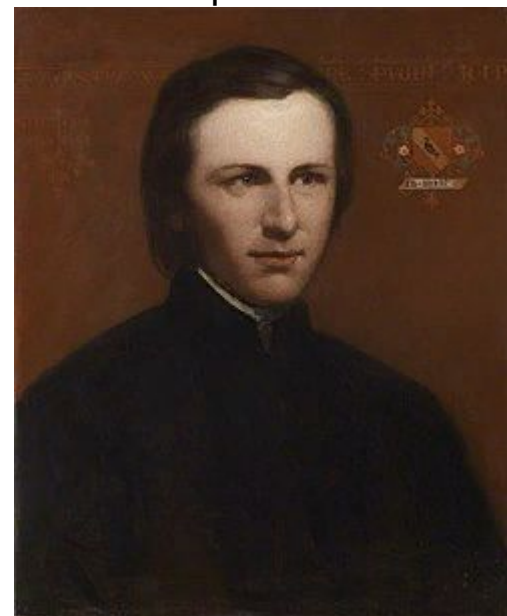
Огастес Уэлби Нортмор Пьюджин