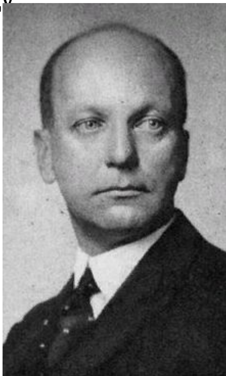
Сэр Джайлз Гилберт Скотт

Во время Второй мировой войны Вестминстерский дворец неоднократно подвергался бомбардировкам (в 1940 и 1941 годах). Больше всего пострадал зал заседаний Палаты Общин, полностью сгоревший от зажигательной бомбы. Реконструкция под руководством архитектора сэра Джайлза Гилберта Скотта началась после окончания войны и была завершена в 1950 году