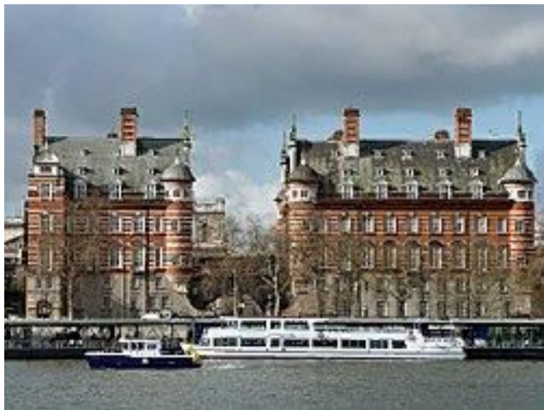
Norman Shaw North (центр) и South (слева)

В 1975 году Парламент приобрёл расположенные поблизости здания Нормана Шоу, в 2000 году было построено здание Порткаллис Хауз.