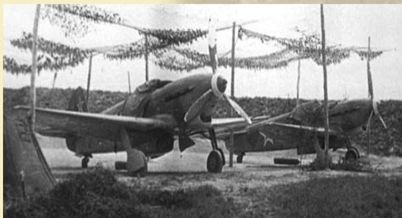
Le Yak 9