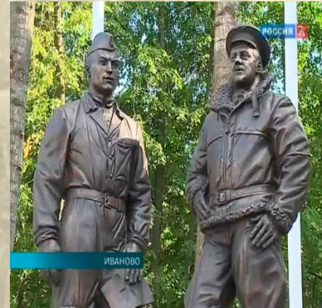
Le monument aux pilotes de l'escadrille «Normandie-Niémen» à Ivanovo.