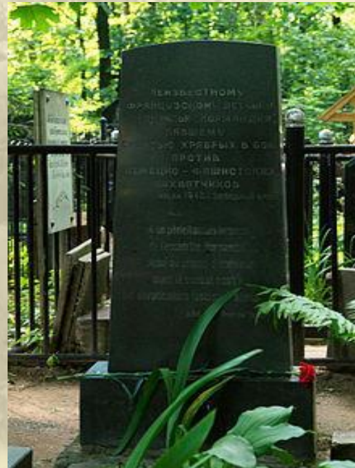
Tombe d'un pilote français inconnu du régiment de chasse «Normandie-Niemen» au cimetière de la Présentation à Moscou