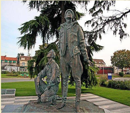
Le monument aux pilotes de l'escadrille «Normandie-Niémen» au Bourget