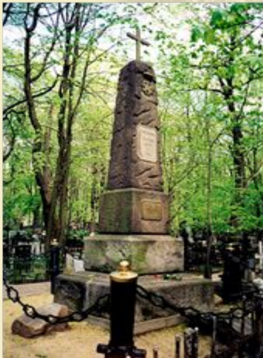
Memorial aux pilotes du «Normandie-Niemen» au cimetière Vedenskoye à Moscou