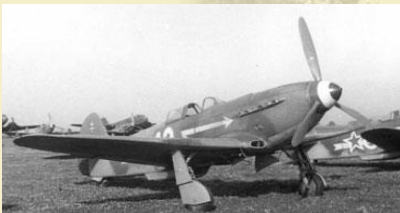
Le Yak 3

Les Français ont beaucoup aimé le Yak, parce qu'il était simple, léger et vite. Ils disaient: «Sur le Yak-3 les deux puissent se battre contre quatre, et quatre contre seize. Sur ces machines, nous nous sommes sentis dans l'air les maîtres absolus».