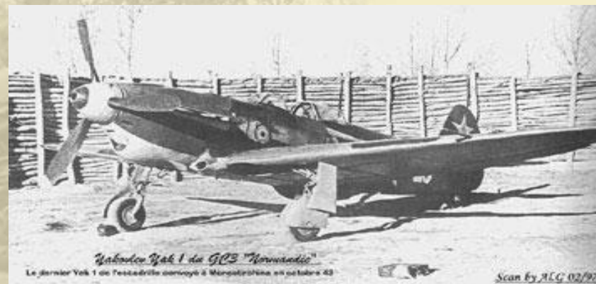
Le Yak 1