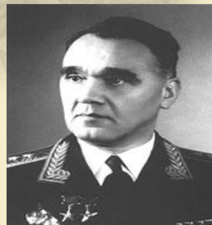
Alexander Serguehevitch Yakovlev