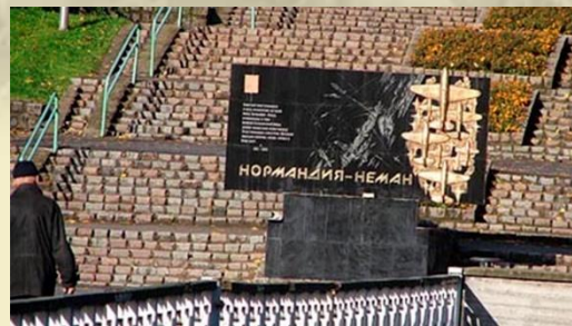
Monument au «Normandie-Niémen» à Kaliningrad près du lac Nijnee.