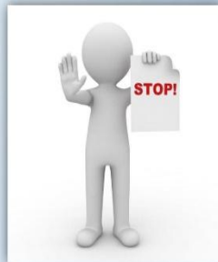
Схема повторений: паузы