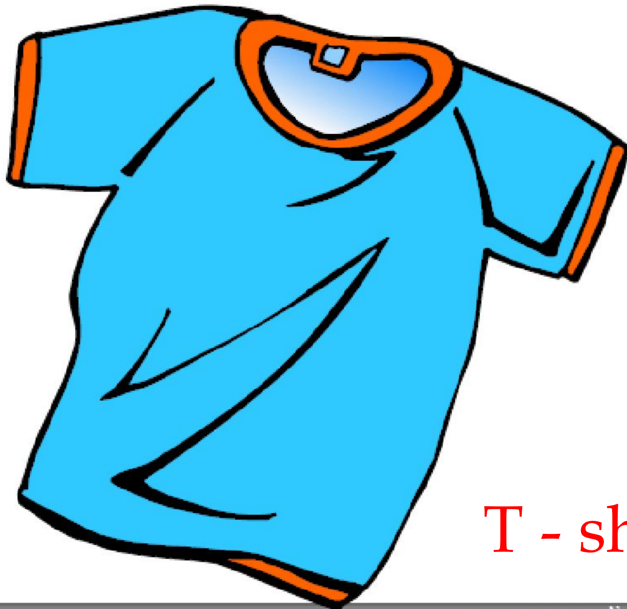
T - shirt