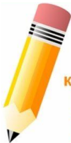
карандаш Pencil ['pensl]