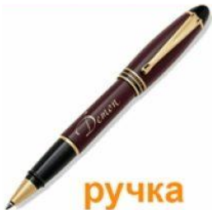
ручка Pen [pen]