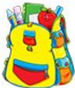
ранец Schoolbag [sku:l.bæg]