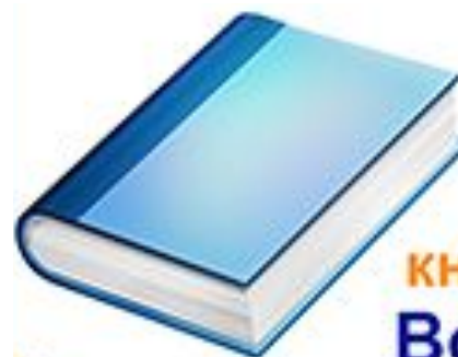
книга Book [buk]