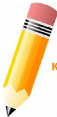
карандаш Pencil ['pensl]