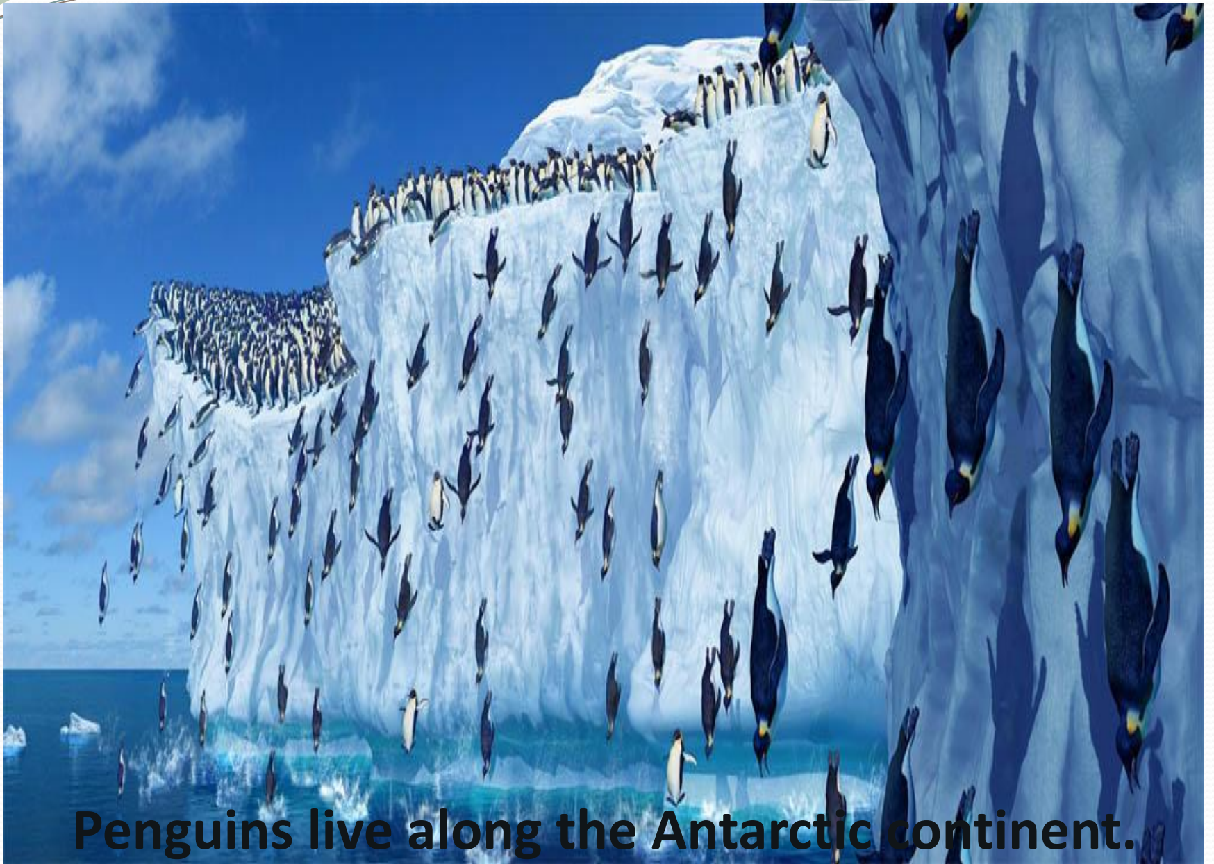
Penguins live along the Antarctic continent.