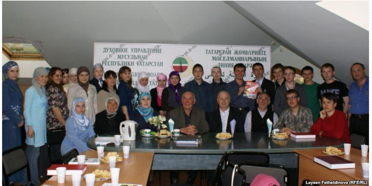
Leyzen Fethetdinova (RFE/RL)