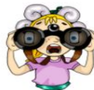
Камелот Алина Рейтинг: 321