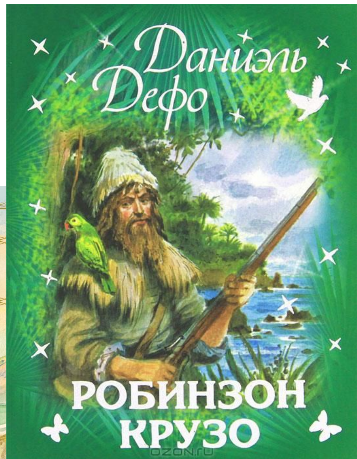
Иллюстрация Анатоль Аткин