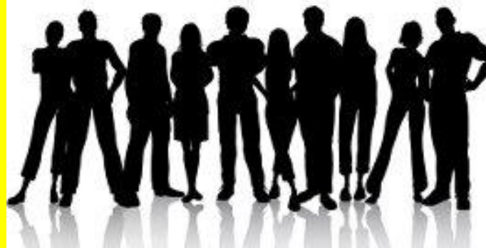
Menschen = Bürger = Das Volk