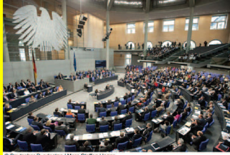
Abgeordnete = Volksvertretung