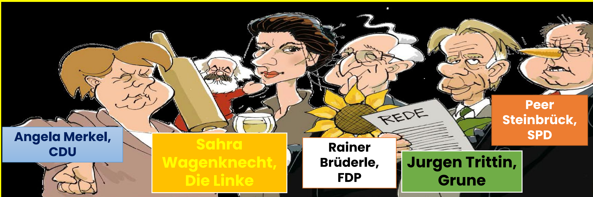
Angela Merkel, CDU