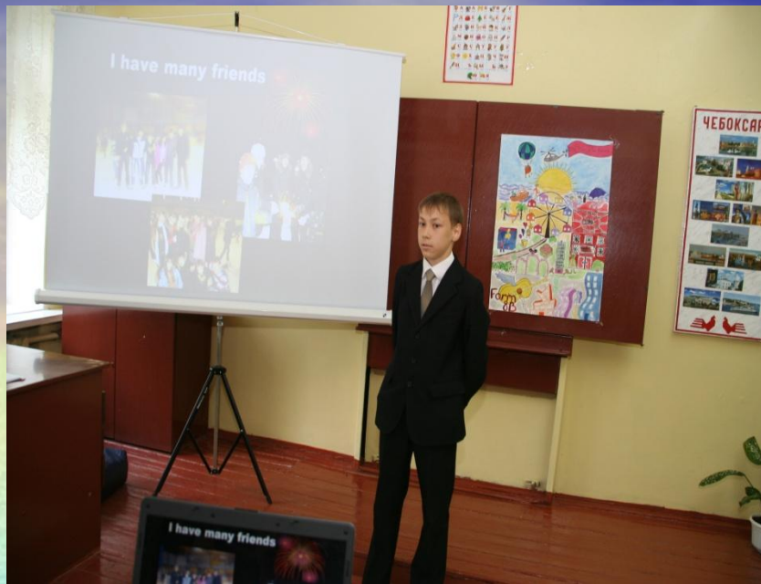
Талисман Новочебоксарска – Бельчонок Новчик.