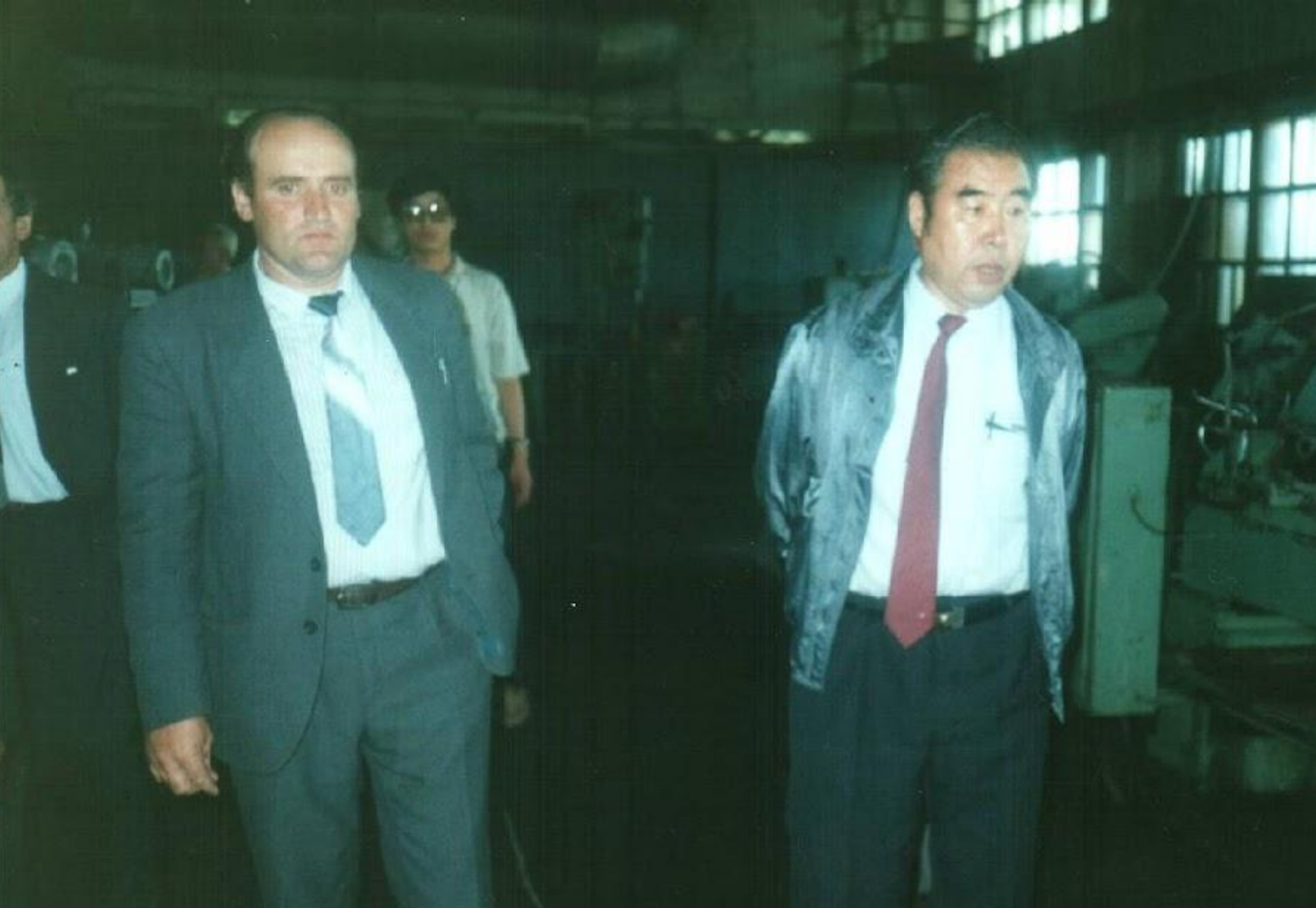
Встреча по обмену опыта с китайцами