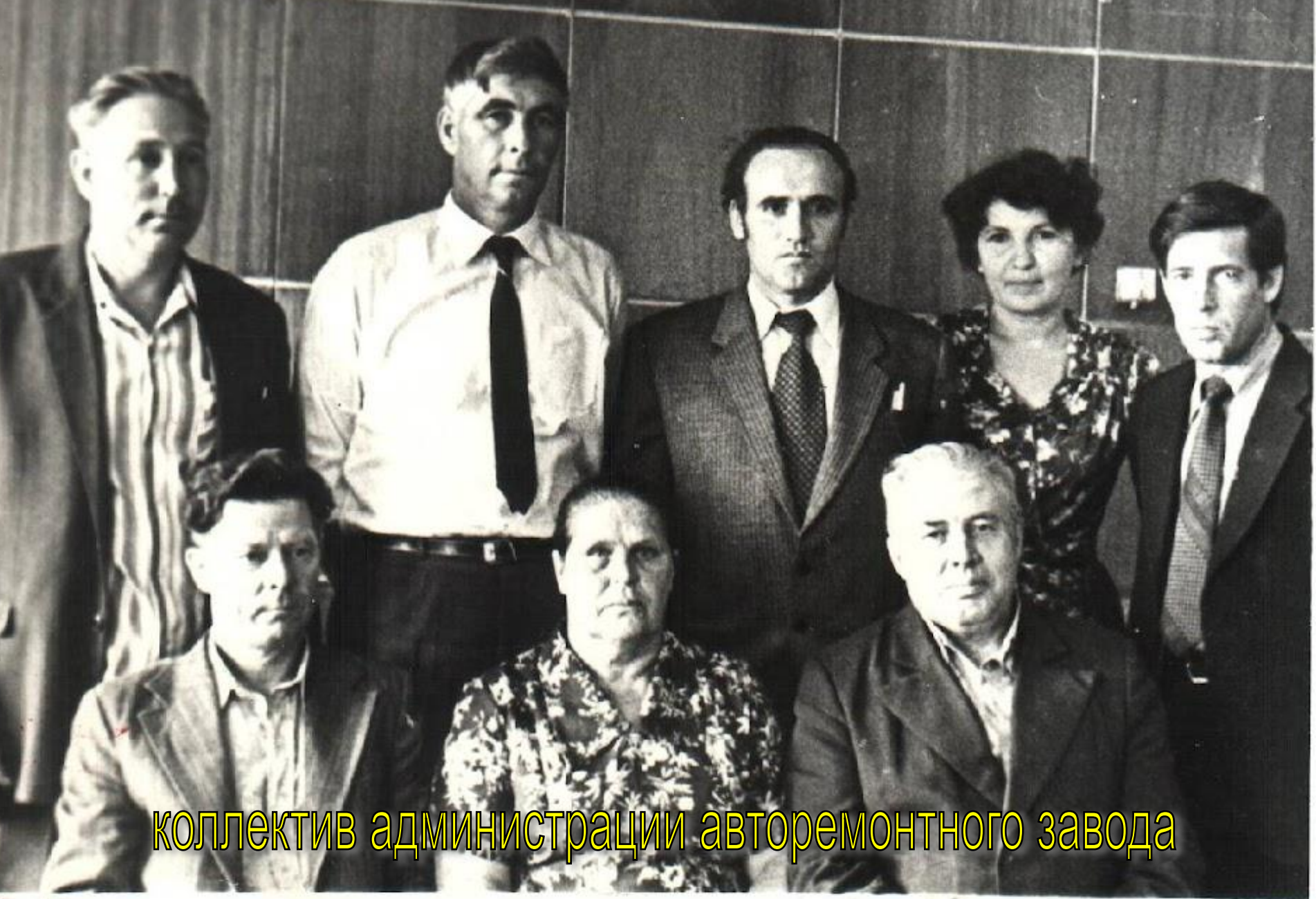
КОЛЛЕКТИВ АДМИНИСТРАЦИИ АВТОРЕМОНТНОГО ЗАВОДА