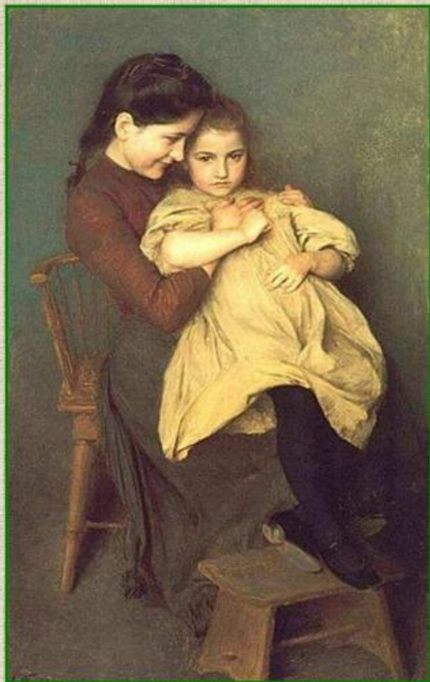
Фриан. «Детское огорчение»