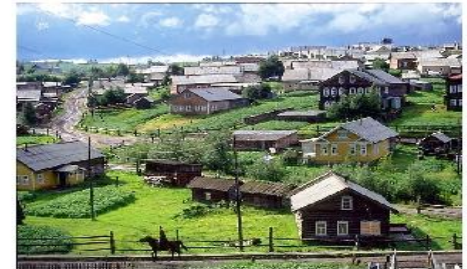
In the country

small houses a lot of animals clean rivers green fields fields hills