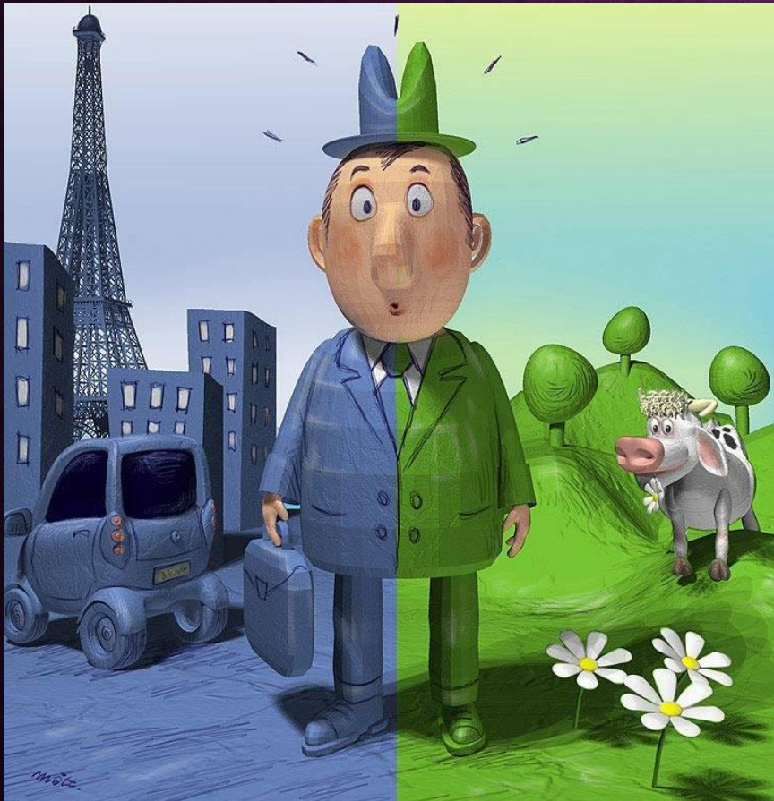
In the city

Ознакомление учащихся с текстом кейса. В начале урока учащиеся делятся на 3 подгруппы по 5 человек читают и обсуждают текст «City and country life». В процессе чтения учащимся также предлагается составить и заполнить таблицу «плюсов и минусов» жизни людей в городе и в деревни. Также на данном этапе учащиеся слушают диалог «Country life – city life».