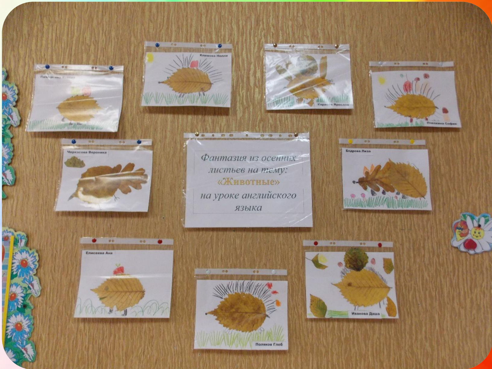
Выставка работ для родителей в холле группы