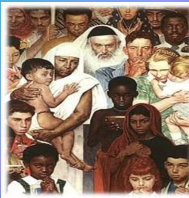
Джон Фицджеральд Кеннеди

ЕСЛИ МЫ СЕРЬЕЗНЕ МОЖЕМ ПОКОНЧИТЬ С НАШИМИ ОТЛИЧИЯМИ, МЫ, ПО КРАЙНЕЙ МЕРЕ, В СОСТОЯНИИ СДЕЛАТЬ МИР МЕСТОМ, БЕЗОПАСНЫМ ДЛЯ МНОГООБРАЗИЯ.