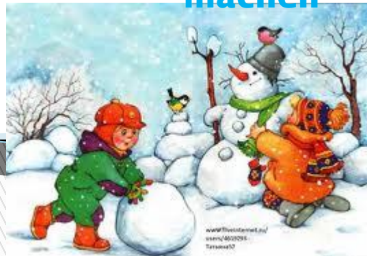
eine Schneemann bauen