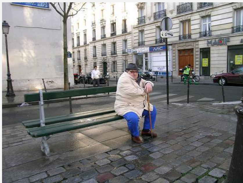
Улица Москвы-реки (Rue de Moscova)