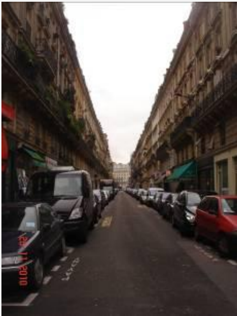
Улица Москвы Rue de Moscou