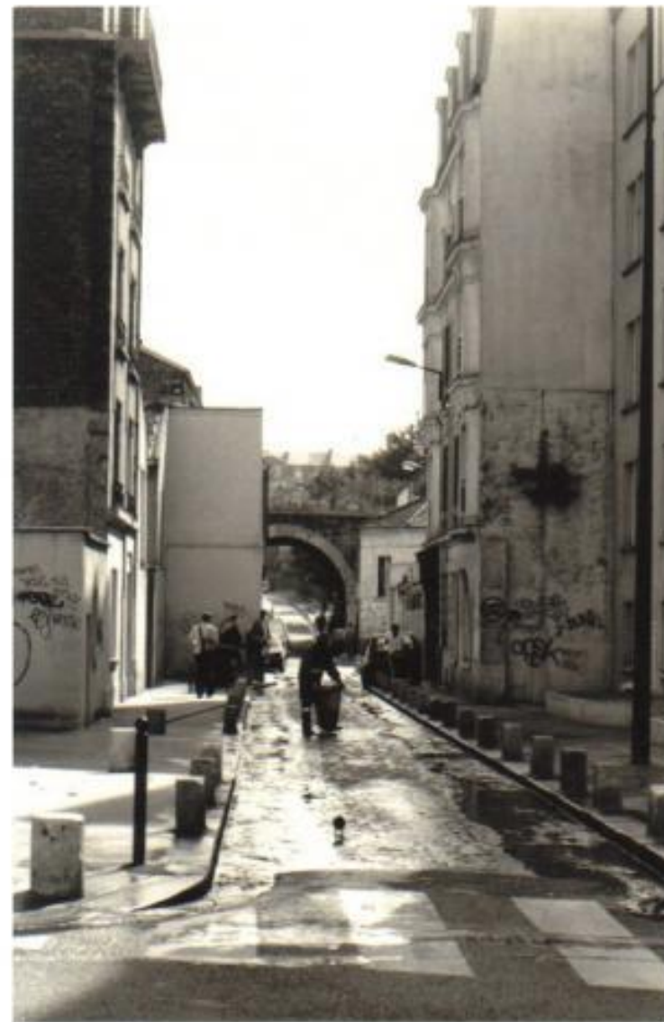
Улица Волги (Rue du Volga)