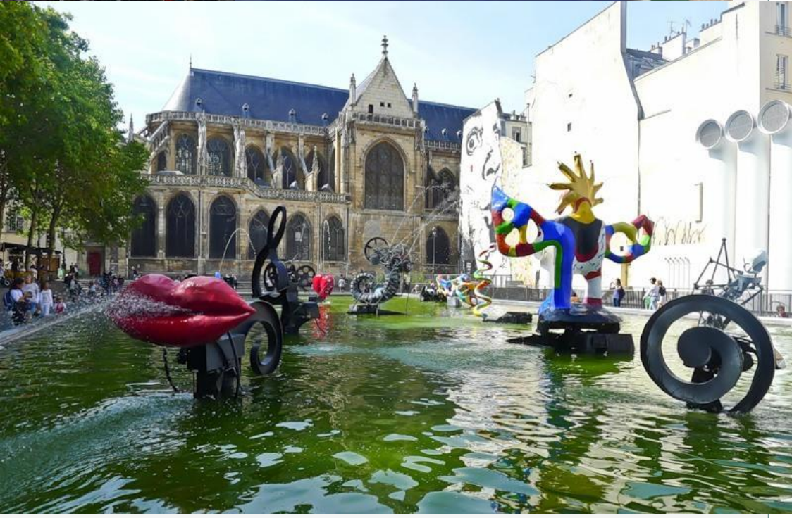
Площадь и фонтан им. Стравинского (Place Igor-Stravinsky et Fontaine Stravinsky)