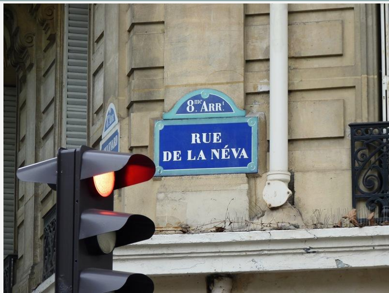
Улица Невы (Rue de la Néva)