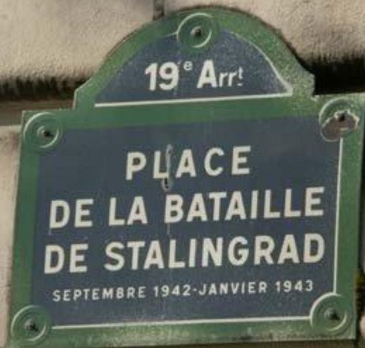
Площадь Сталинградской Битвы Place de la Bataille-de-Stalingrad