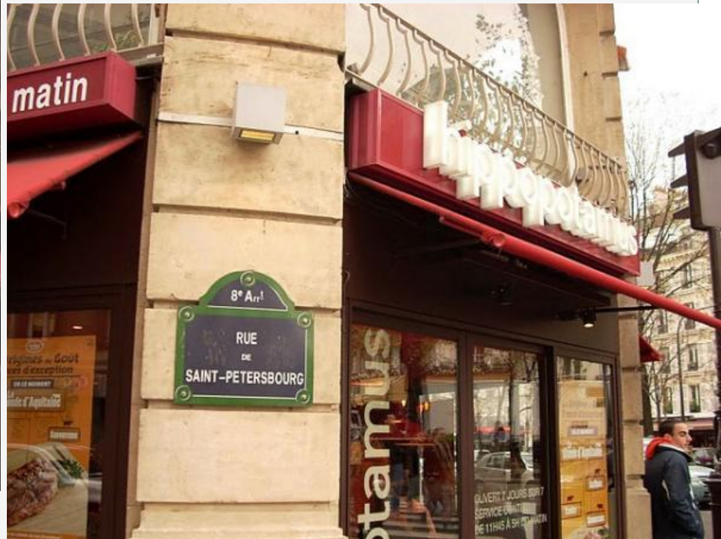
Улица Санкт-Петербурга Rue de Saint-Pétersbourg