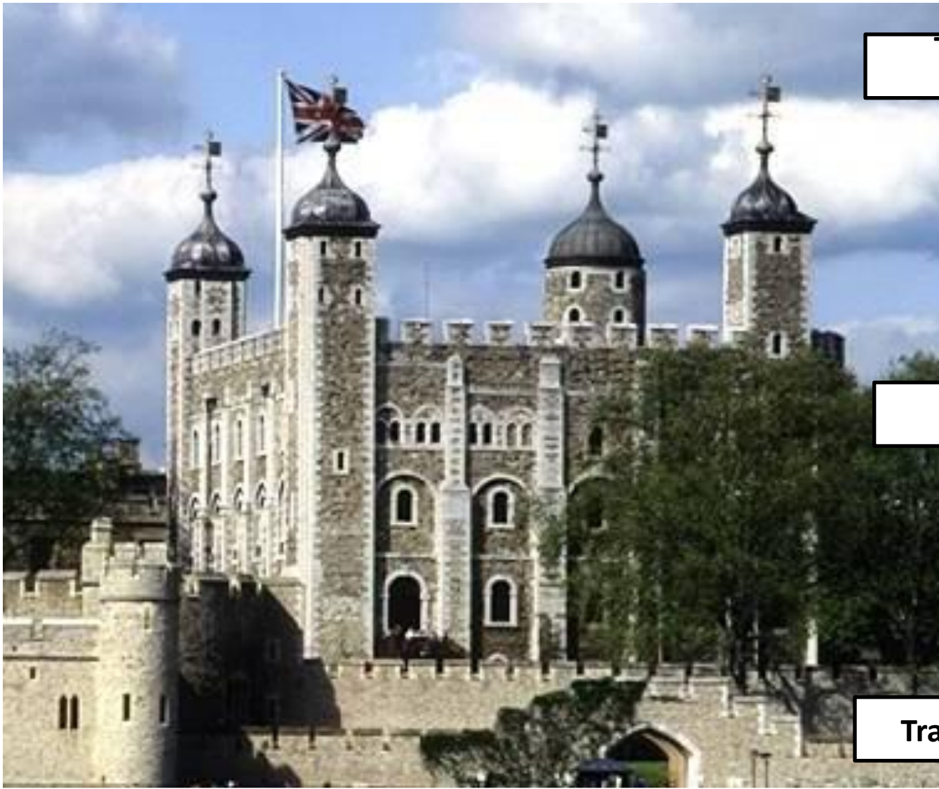
The Tower of London