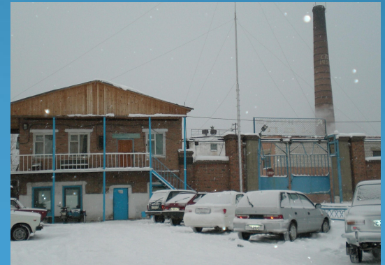
Join-stock company "Yurtinskles"