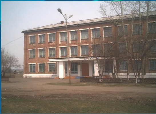
School № 17