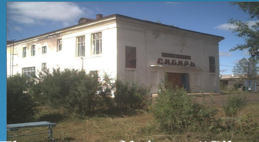
The centre of leisure "Siberia"