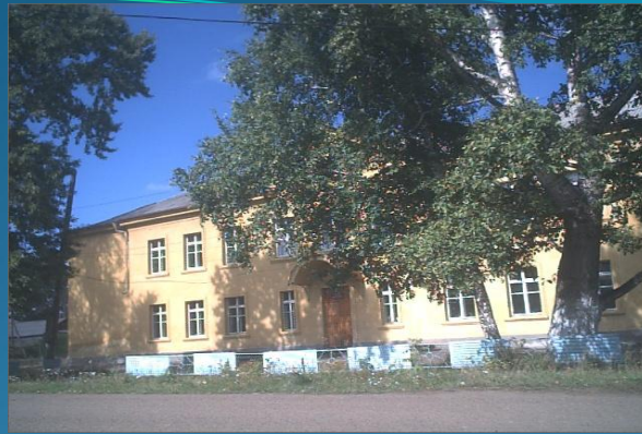
School № 24