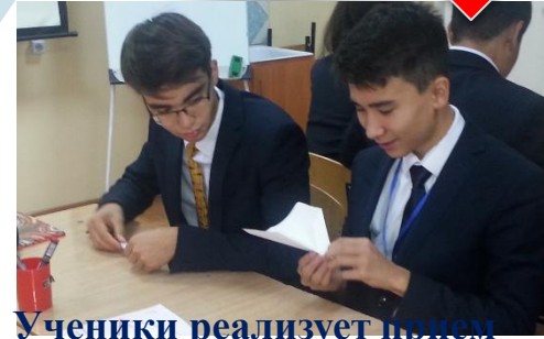
Ученики реализует прием «Самолёт»