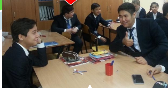
Ученик А оценивает ответ ученика В