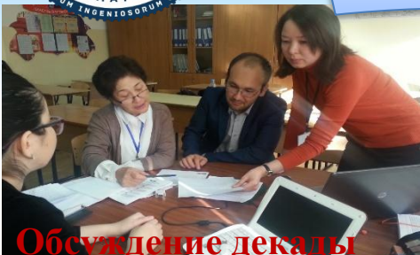
Обсуждение декады английского языка

Тема: Применение новых подходов в преподавании и обучении как основной инструмент развития творческого потенциала учителей 21 века