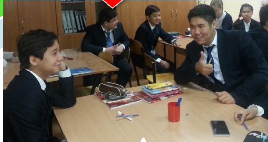
Ученик А оценивает ответ ученика В