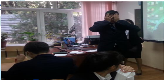
Прием «Десять вопросов»

Ученик А прилагает все усилия по решению вопроса