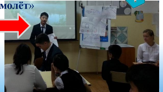
Прием «Карусель». Защита проекта