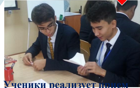
Ученики реализует прием «Самолёт»