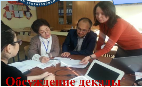
Обсуждение декады английского языка

Тема: Применение новых подходов в преподавании и обучении как основной инструмент развития творческого потенциала учителей 21 века