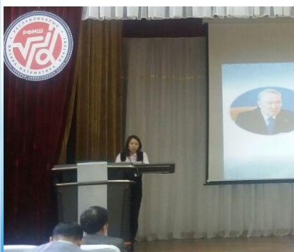
Воплощение идеи педагогического совета «На одной из улиц Лондона»