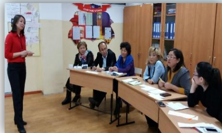
Учителя МО английского языка

Тема «Использование стратегии активного обучения для поддержки групповой работы и коллаборативного решения проблем»