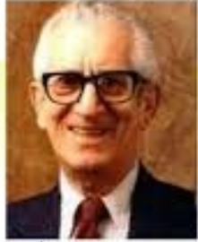
Бенжамин Блум, 1956