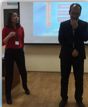
Учителя выявили проблему коучинга

Цель: определить эффективность использования приемов коллаборативного решения проблем в учебно-познавательном процессе.