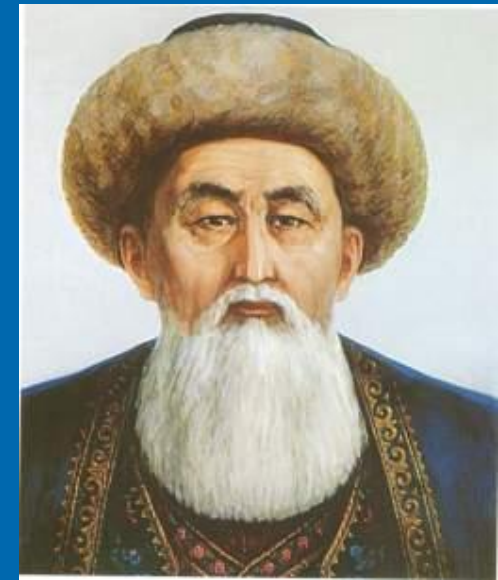
Кіші жүздің төбе биі