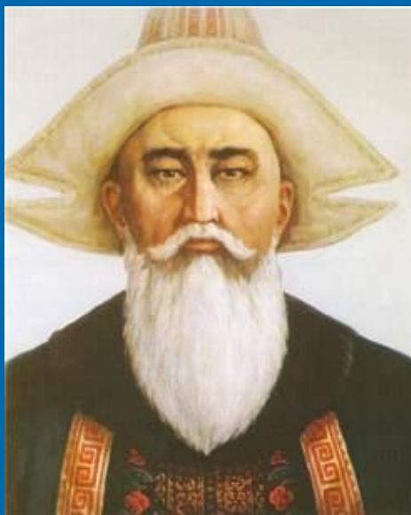
Орта жүздің төбе биі