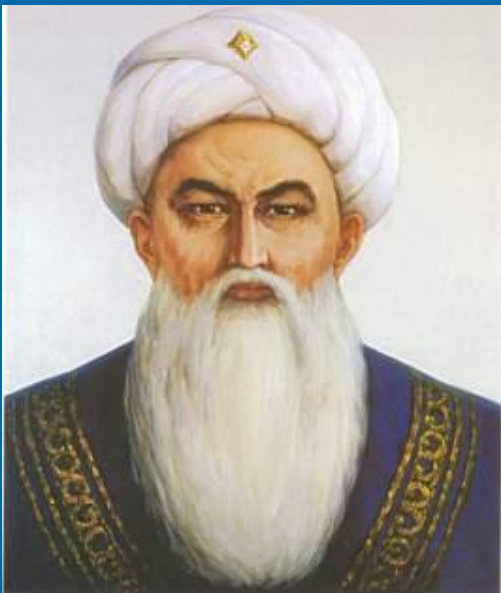
Ұлы жүздің төбе биі