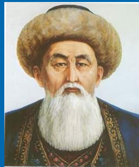
Кіші жүздің төбе биі