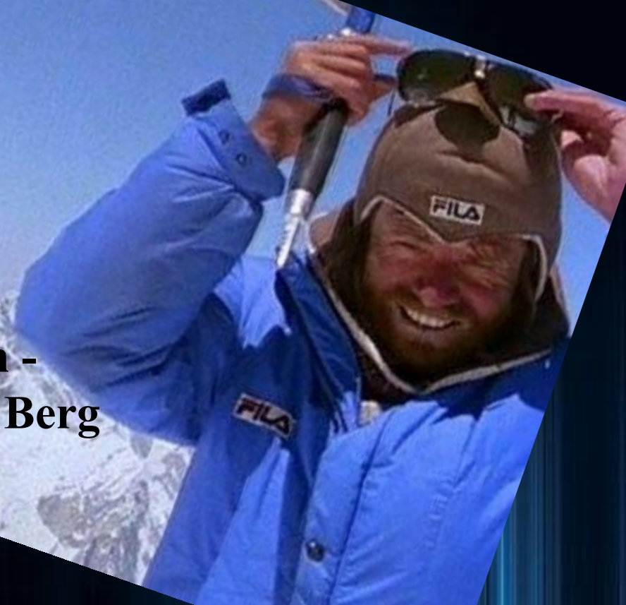
Gasherbrum - Der leuchtende Berg