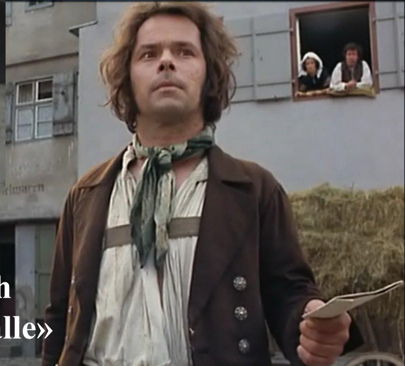
«Jeder für sich und Gott gegen alle»