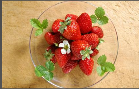
a plate of