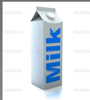
a carton of milk