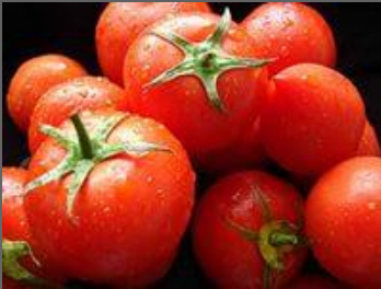
a kilo of tomatoes