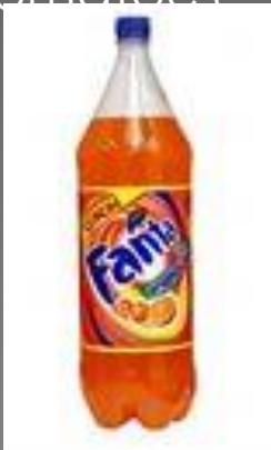
a bottle of Fanta