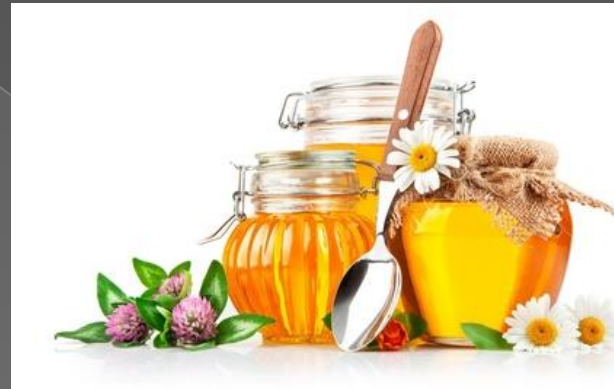
a jar of honey