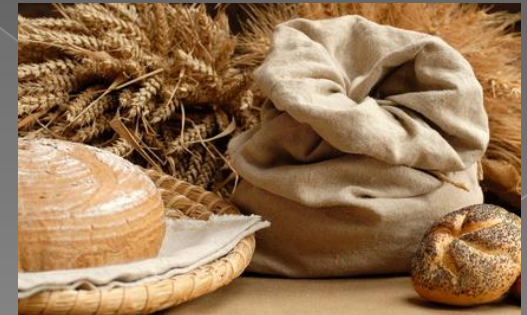
a bag of flour