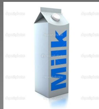
a carton of milk