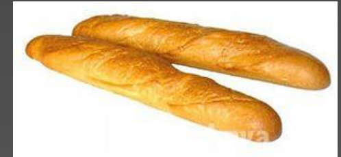
a loaf of bread