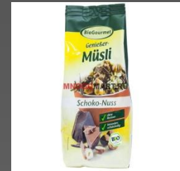
a packet of muesli