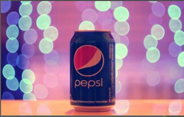
a can of Pepsi