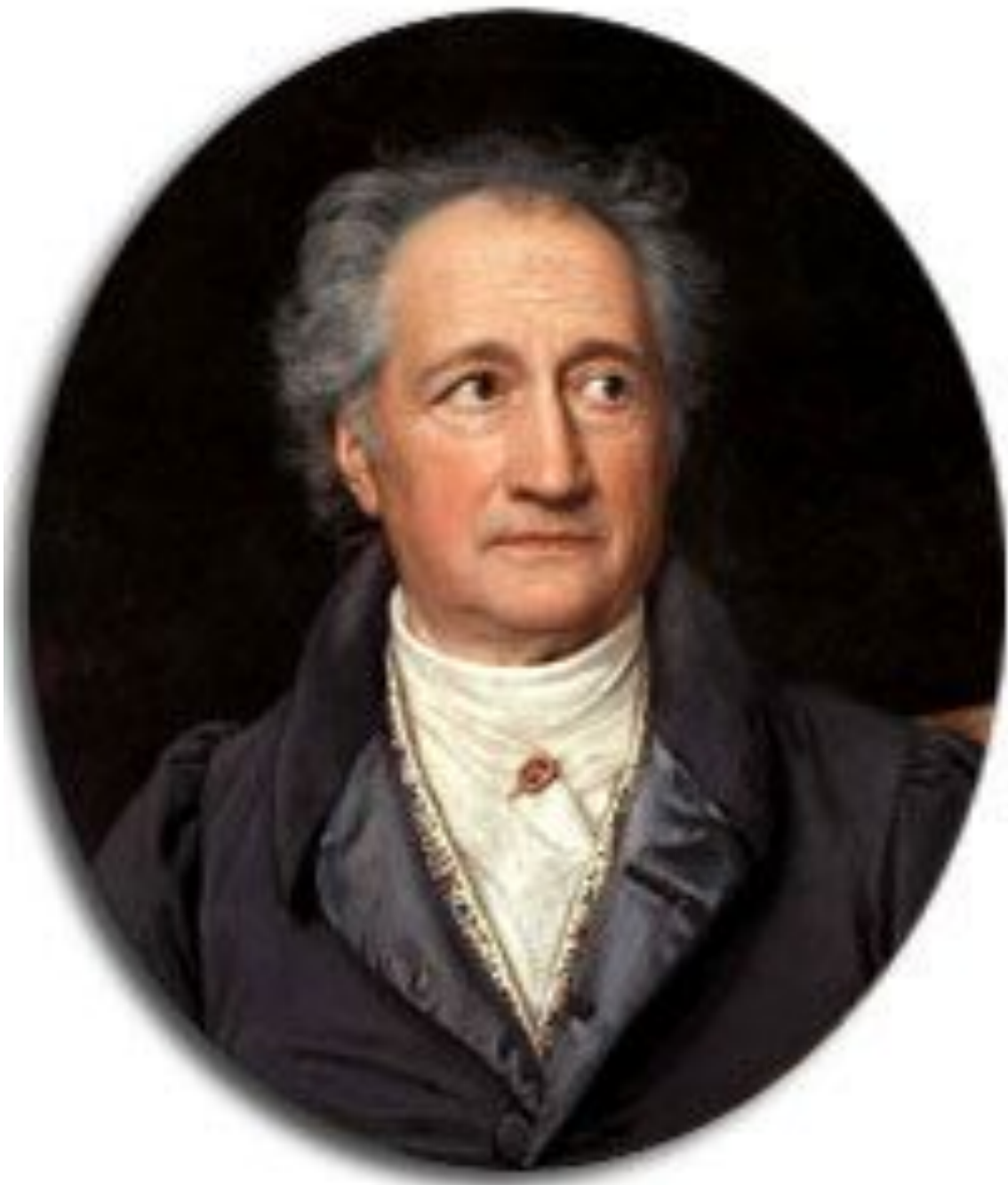
Johan Wolfgang von Goethe (1749 – 1832)