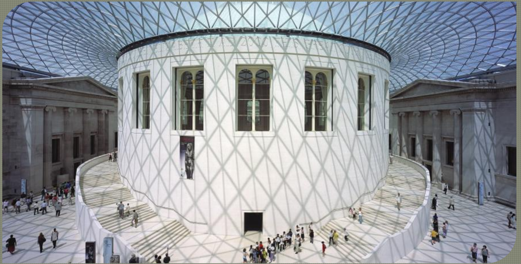
Британский музей и Оксфорд стрит.