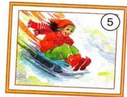
Das Mädchen rodelt.