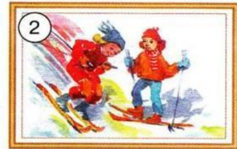
Die Kinder laufen Schlittschuh.