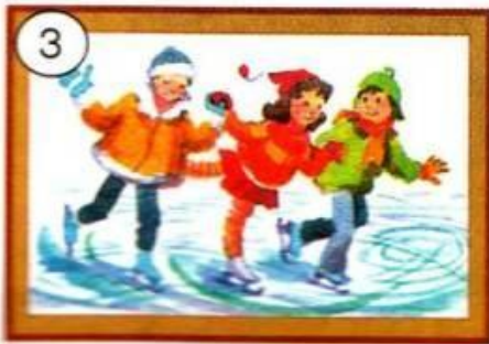
Die Kinder laufen Schi.