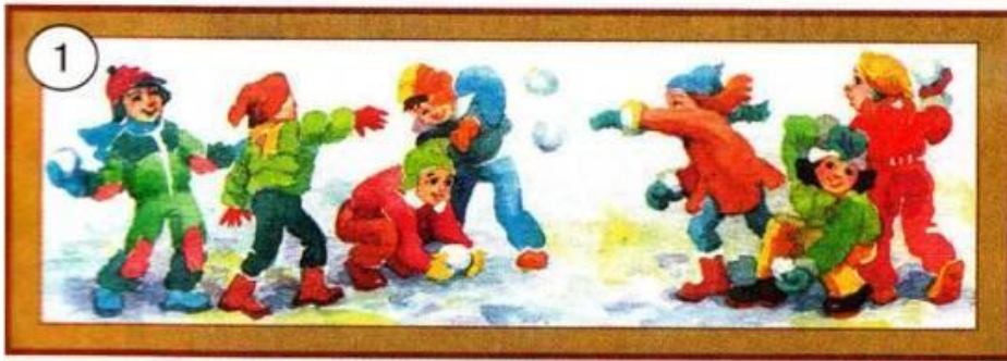
Die Kinder bauen einen Schneemann.