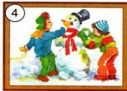
Die Kinder machen eine Schneeballschlacht.