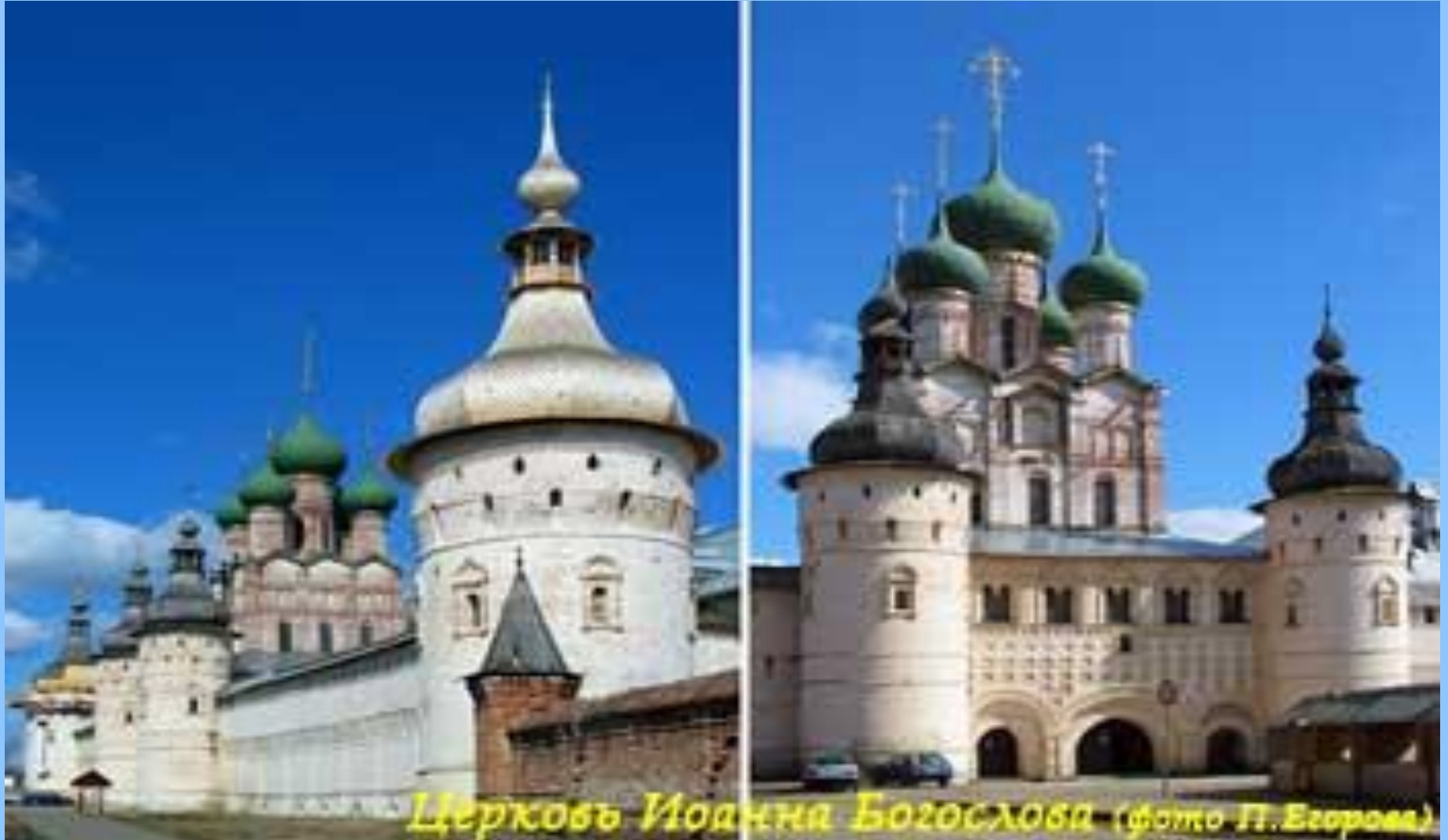
Церковь Иоанна Богослова