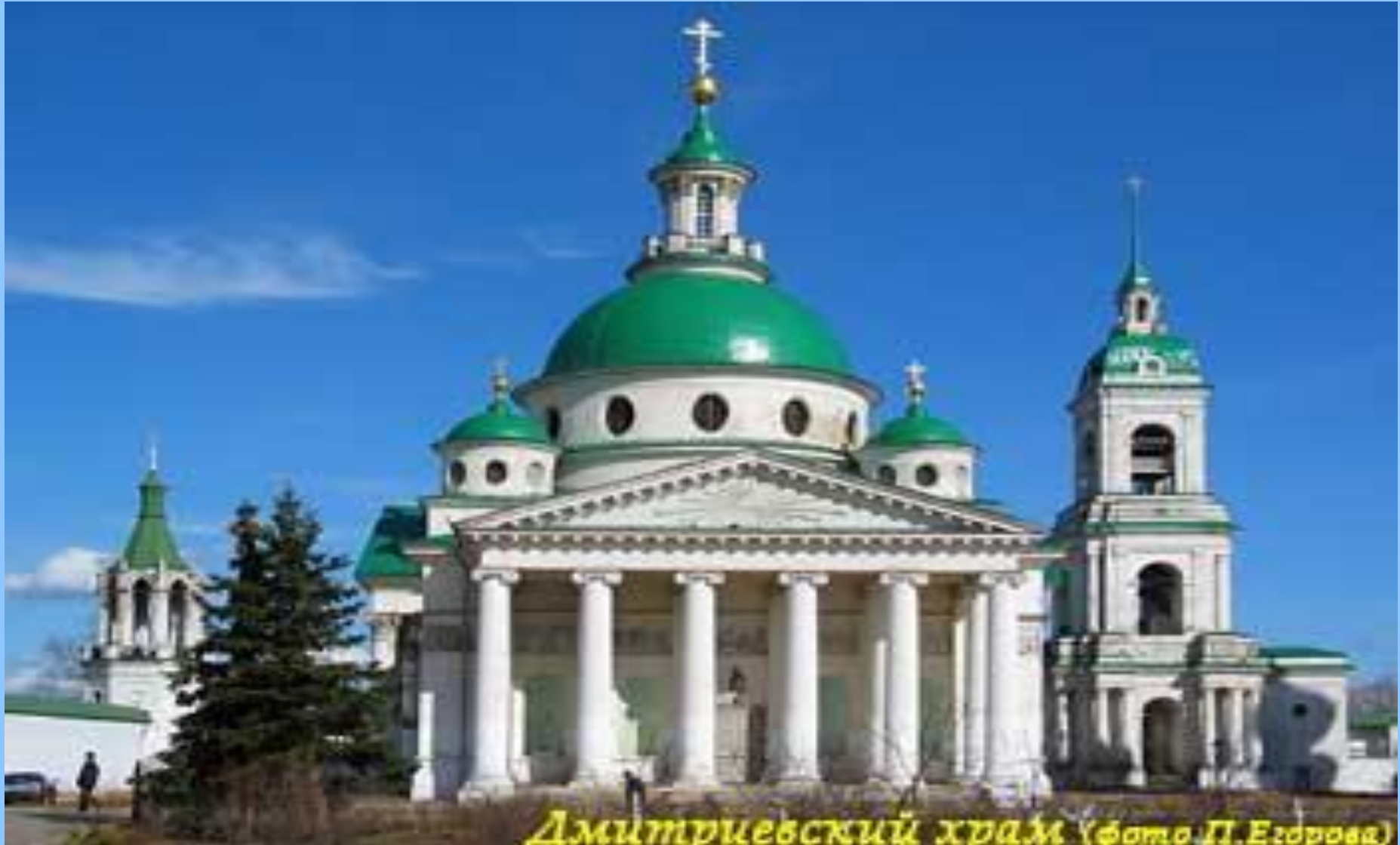
Дмитриевский храм