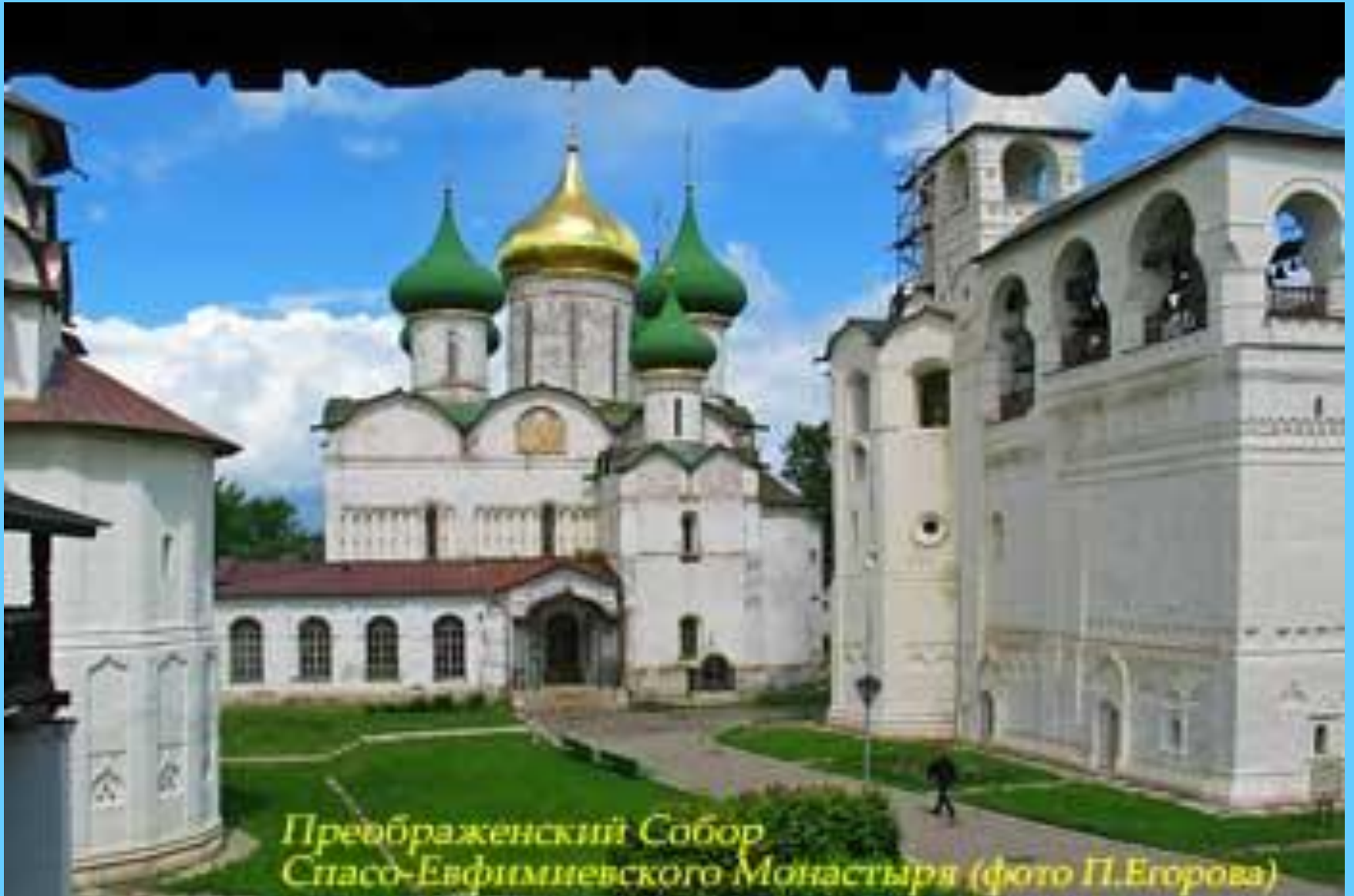
Превображенский Собор Спасо-Евфимиевского Монастыря