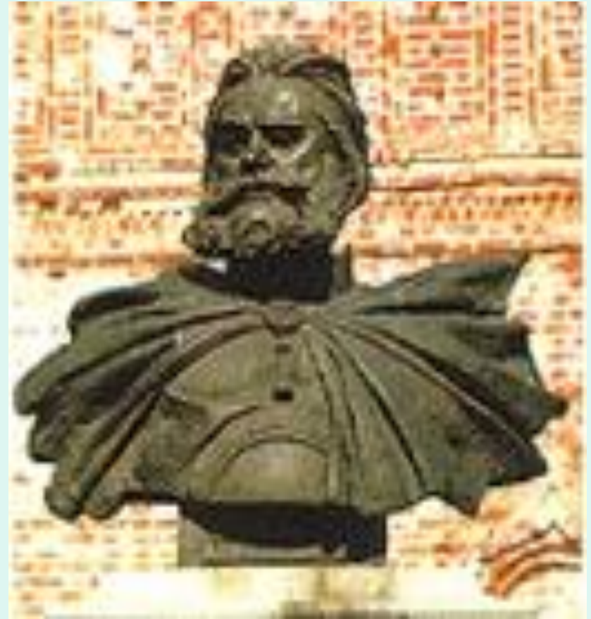
Das Denkmal in Susdal