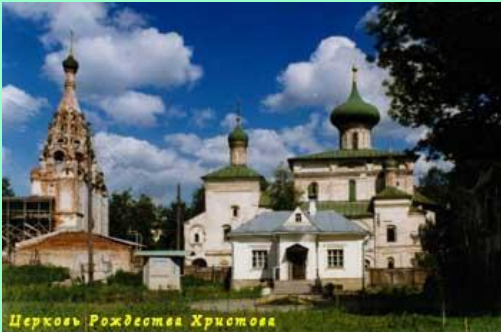
Церковь Рождества Христова