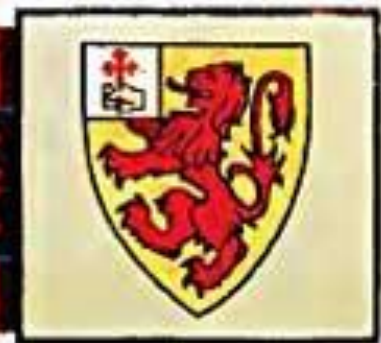
MACDONELL OF KEPPOCH