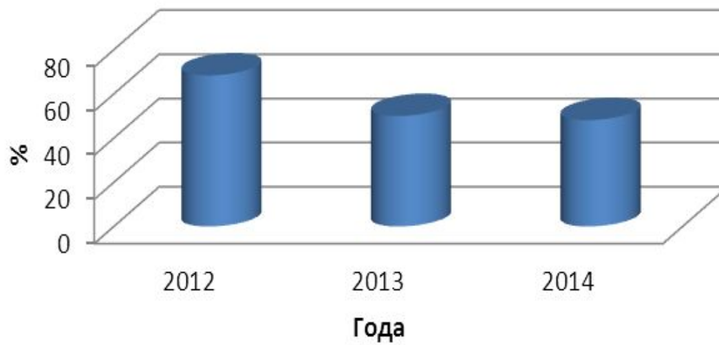
ЗАДАНИЯ А1-А7 АУДИРОВАНИЕ С ВЫБОРОЧНЫМ ПОНИМАНИЕМ СОДЕРЖАНИЯ (повышенный уровень)