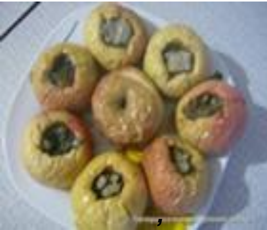
Die Bratäpfel im Backofen