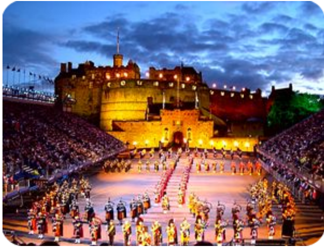
Royal Scots Dragoon Guards Pipes & Drums

Большой вклад в развитие мирового интереса к шотландской волынке внёс один из лучших военных оркестров волынщиков Шотландии Royal Scots Dragoon Guards Pipes & Drums, прославившийся своими совместными трудами с Полом Маккартни, Марком Нопфлером, а также многими рок- и поп-звёздами Великобритании и Голливуда. Именно он впервые исполнил на волынках в Британском радио эфире «Amazing Grace». Это произведение в свое время побило все рекорды популярности, а затем стало неувядающей классикой. Песню «Amazing Grace» исполнял в свое время Сам король рок-н-ролла Элвис Пресли.