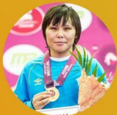
Жұлдыз Эшимова 48 кг

Национальная сборная Казахстана на Олимпийских играх в Рио-де-Жанейро