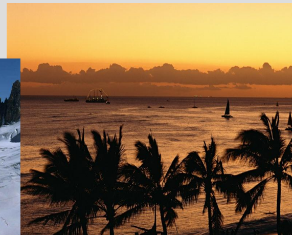
The Black Sea