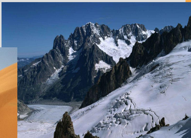
The Alps - Альпы