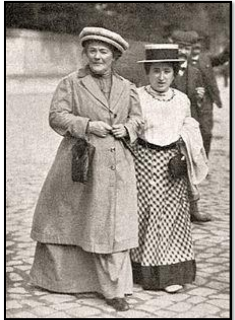
Клара Цуткин 5 .06. 1857 ж

Клара Цеткин 8 наурыз күнін халықаралық әйелдер күні ретінде атап өту туралы ұсыныс жасайды.