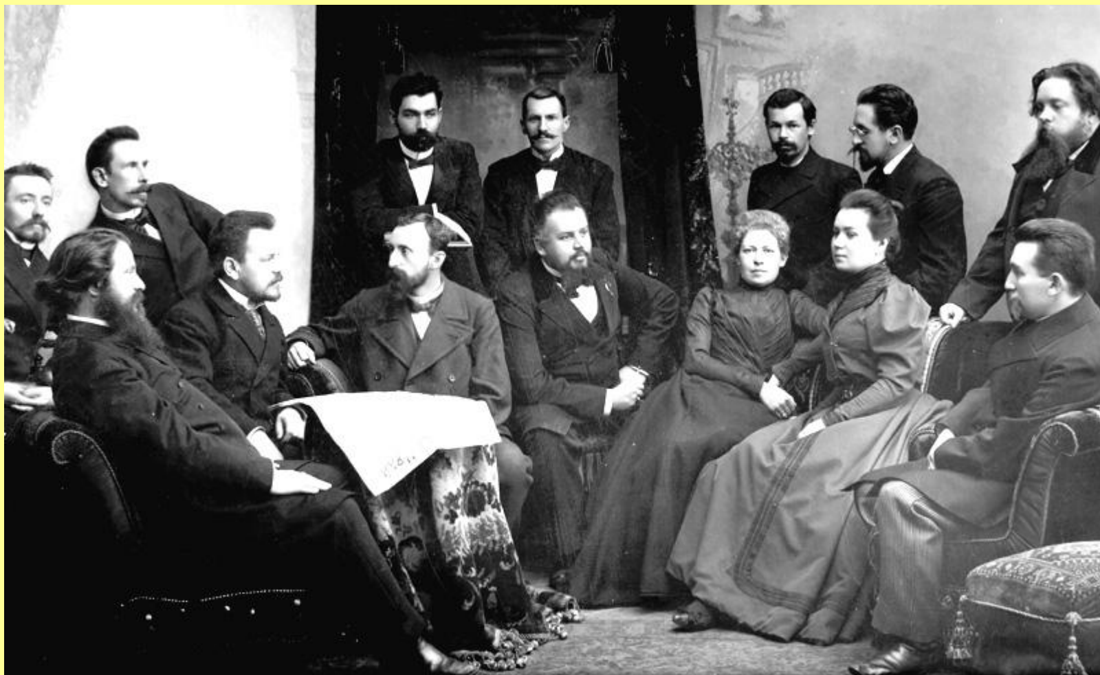
Первые сотрудники «Северного края»