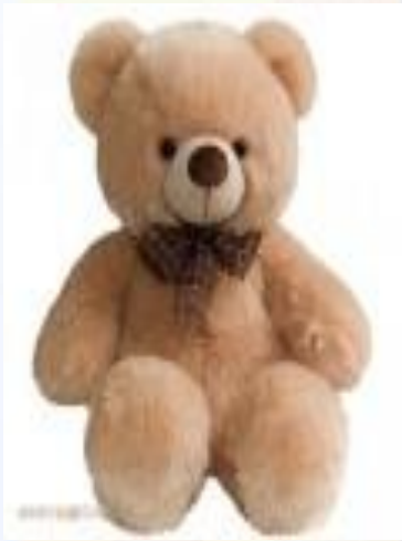
a teddy bear