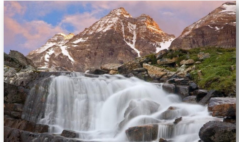
Природа Северной Америки

Как и в других странах своего распространения, английский язык был "привезен" в Северную Америку колонистами в 17-18 вв. До наших дней американский вариант английского языка претерпел множество изменений под влиянием различных факторов.