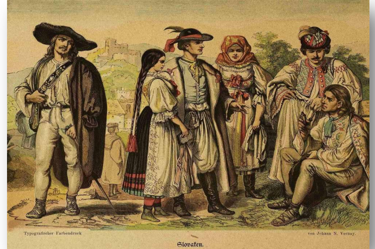
Славяне из Европы

Особенностью канадского варианта английского языка являются многочисленные французские заимствования, а также заимствования из славянских языков.