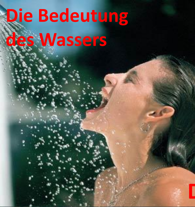
Die Bedeutung des Wassers