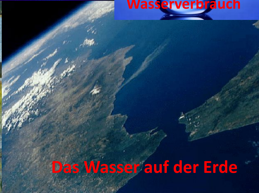
Das Wasser auf der Erde