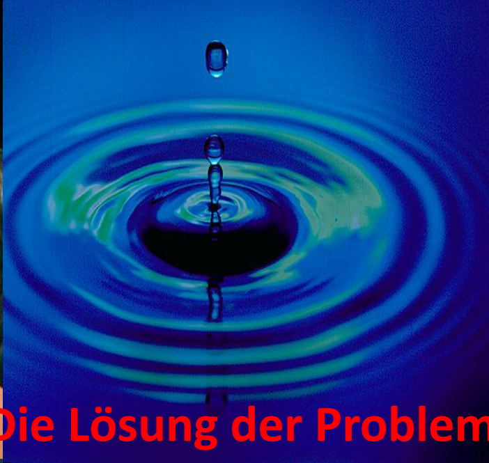
Die Lösung der Probleme