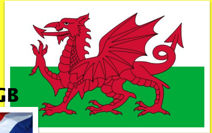
The flag of Wales