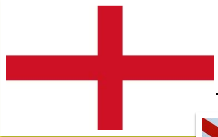
The flag of England