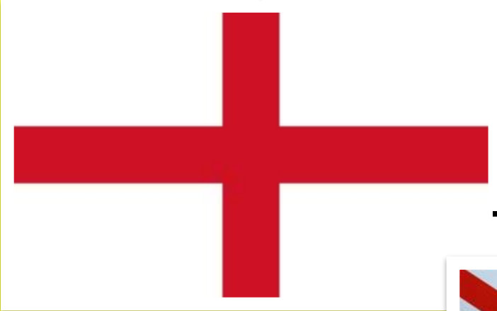
The flag of England