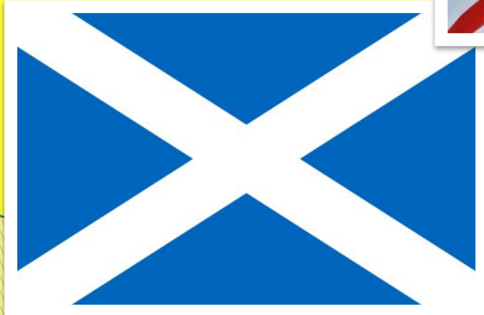
The flag of Scotland