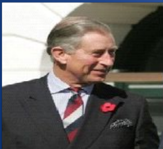
Charles, Prince of Wales,