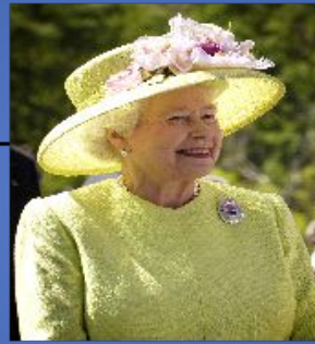
ELIZABETH II b. 1926