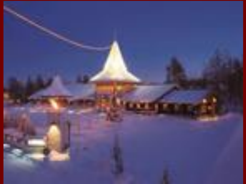
Домик Санта – Клауса Santa Claus' house